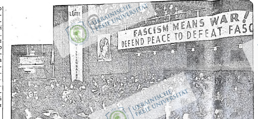
Поперечний знімок частини загальної делегації Восьмого конгресу КПК.

Ми, комуністи, обороняємо демократію, бо ми стоїмо перед обличчям боротьби за прогрес і за соціалізм у всіх її обличчях і у всіх її імплікаціях. Оборона демократії тепер є центральним завданням, що стоїть перед прогресивним народом. Рішальним питанням, за яке сьогодні йде боротьба в капіталістичних країнах є не фашизм або комунізм, а демократія або демократія. Оборона демократії є рішучою формою боротьби проти реакції і за втримання шляху відкритим для прогресу.