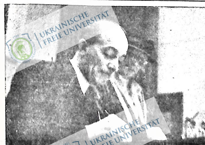
Альфред Косте, французький делегат від Комуністичної Партії Франції.

І тут знову, як і в домашній політиці, бажання великого капіталу є в прямій суперечності з інтересами й бажаннями мас канадського народу, й ті бажання можуть бути досягнені проти волі народу. Тому кам-