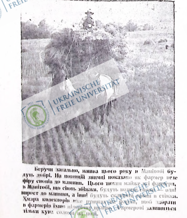
Беручи загально, жінка цього року в Манітобі будуть добрі. На позиції знімки показано як фармер веде фіру своєю до машини. Цього тижня майже всі фармери в Манітобі, що стовт збирав, будуть вносити пшениці один широк до машини, а інші будуть скосити свої в стівки. Хмара колекторів вже ринуть на поля, щоб заарати і фармери їхню пшеницю вранці. Фармерів заширили тільки купа соломи на полях.

За кожний бушель пшениці, що Канада імпортує в Сполучені Штати вона мусить платити 12 центів мита.