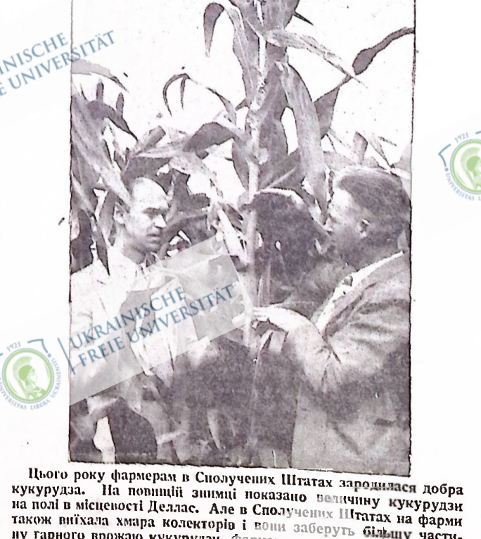
Цього року фармер в Сполучені Штатах зародилася добра кукурудза. На позиції знімки показано величину кукурудзи на полі в місцевості Деллас. Але в Сполучені Штатах на фарми також вихала хмара колекторів і вони заберуть більшу частину гарного врожаю кукурудзи. Фармер залицяється тільки могол на руках як заплава за їхню щоденну працю.