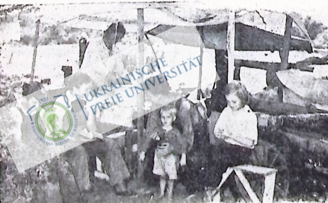
70,000 осіб в Сан Дієго в долині, в етаті Каліфорнія, США, покинули свої домівки в наслідок страшної посухи і сільної паші на бік мортелних компаній і пустились на маршівку шукати "кращого шмаття". На певній картині показується одна така фармерська родина розташована на двох гектарах річної худобу поширюється серед них безземельні родини, які життя фармерських родин в набагатішіх країнах світу.

Причин такого стану, який комує уряд не дали ніякої дефінітивної відповіді, які кроки вони підприємнуть і яку суму вони думають видати на цю ціль. Щодо переселення наші і покинули в посушливі околиці, міністр рільництва, Тегарт, заявив, що "немає досить паші для цієї худоби і що багато голів худоби, включаючи худобу, що є на розп'яті, треба буде переселити в інші місцевості, або випродати на основні плани, який тепер пропонує міністерський уряд.