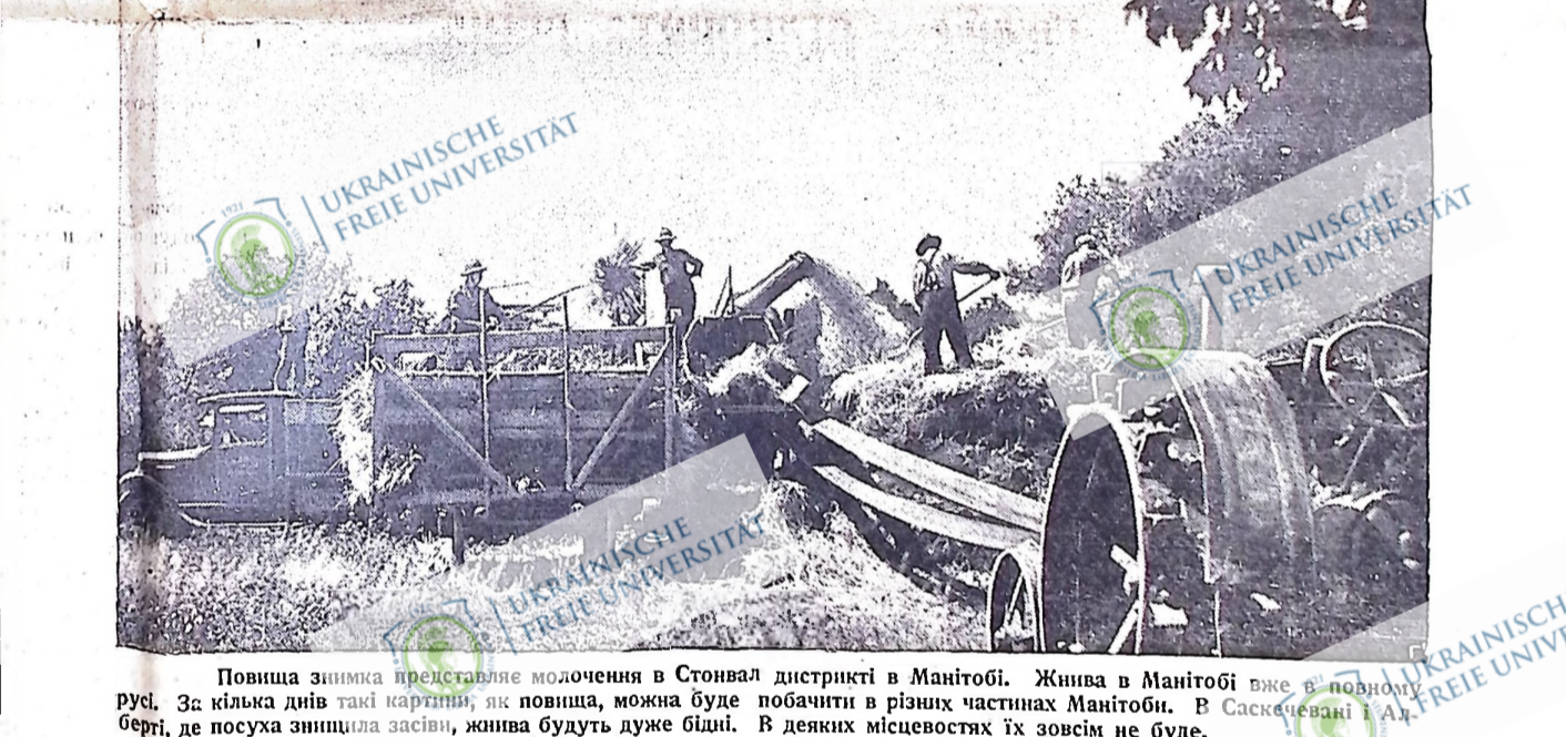
Повища знімка представляє молочення в Стонвал дистрикті в Манітобі. Живна в Манітобі вже в повному русі. За кілька днів такі картини, як повища, можна буде побачити в різних частинах Манітоби. В Саскчевані і в Берті, де посуха знищила засіви, живна будуть дуже бідні. В деяких місцевостях їх зовсім не буде.