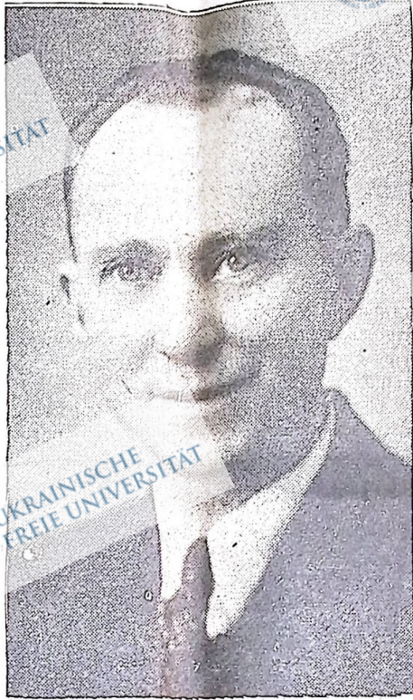
Тим Бака, секретаря Комуністичної партії Канади.

Ми перестерегаємо перед ілюзіями вигаданими добутиє цих домагаючихся практичних планів, які не брали б ніякого увагу джерела доходу, майстків і зисків експлуататорів албертійського багатства і покращення праці албертійському народові.