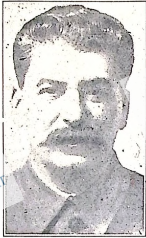
ЙОСИФ СТАЛІН, генеральний секретар ВКП(б)

Три радянські герої-авіатори Чкалов, Байдуков і Беляков, які безпосадочно перелетіли з Москви до Сполучених Штатів через північний полюс, вислали з Портленд відповідь-телеграму на ім'я Йосифа Сталіна на його привіт, в якій висказують свою радість з приводу перемоги радянської авіації та дякують цілому радянському народові за підтримку, яка зробила таку небезпечний переліт можливим і доклавши спеціально вони дякують Сталіну, ім'я якого заохочувало їх до перемоги.