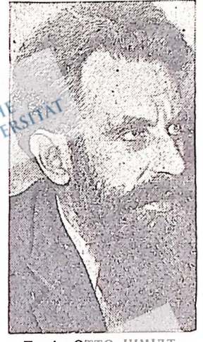
Проф. ОТТО ШМІДТ, славний дослідник північних полюсів

З Герона, Іспанія, повідомляють про одержані відомості, що на біло помальований корабель, без жодних знаків, які вказували б на його тожність обстрілювали і затопили минулого четверга іспанське торговельне судно, яке супроводжало французький корабель. Невідомий корабель не атакував французького корабля. Доконавши свого дикунського діла, він поплив повною силою на південь.