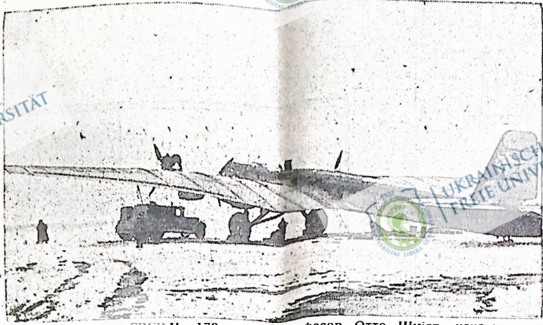
Радянський аероплан СРСР Н-170, в якому професор Отто Шмідт, начальник радянських морських вільхів на Північному океані, і три радянські пілоти та механік перелетіли через Північний полюс і приземлилися на льоду, щоб встановити там научну експедицію.