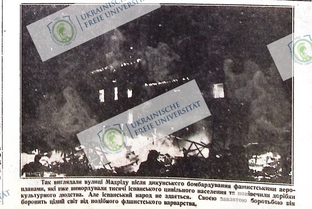
Так виглядали вулиці Мадриду після дикунського бомбардування фашистськими аеропланами, які вже вимордували тисячі іспанського цивільного населення та понівелили доробки борючий цілий світ від подібного фашистського варварства.

Тепер порівняємо ціни на пшеницю в період з 1910 до 1915 рр. і ціни на пшеницю в період з 1930 року.