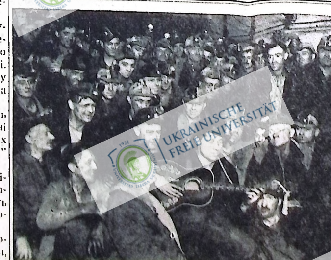
Біля 500 матерей Суніпор Коа Ко. у Вилсоні, Манітобі, страйкували в середині майна. Вони домагались ринковий контроль над цінами на папір. Суперінтендент заявив, що вони можуть так робити, якщо доки не попишуть з голоду, але їхні родичі стверджують, що вони попишуть.

Всі жертви посилайте на таку адресу: Friends of the Mackenzie-Papineau Battalion, 929 Bay St., Toronto, Ont. Прислати свою братерську допомогу через океан!