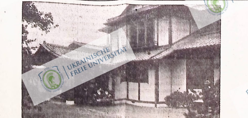
На образку — дім спеціально побудований для швейцарського прем'єра Гамілі. Цей дім називають "домом секретів". В ньому є секретні входи і виходи, рухомі підлоги, як рійшок кімнати, що захищені перед брідками.

(Поворотом — Шорт Влас.) Маючи на продаж постійний склад найкращих швейцарських і американських машин і дерев'яних умислових знаряд, а також шини і гуму. Телефонуйте 5611 566 SELKIRK AVE., WINNIPEG, MAN.