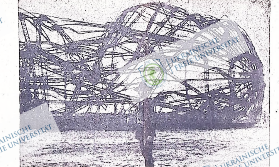
На північній знімці показано рештки з німецького цепеліна "Гінденбург", який розбився 8 травня в Лейкгорст, Нью Джерсі. В катастрофі 36 осіб втратило життя.

На фронті коло Толедо урядові війська прогнали в минулий четвер з першої лінії окопів фашистські сили, які обороняють місто Толедо.