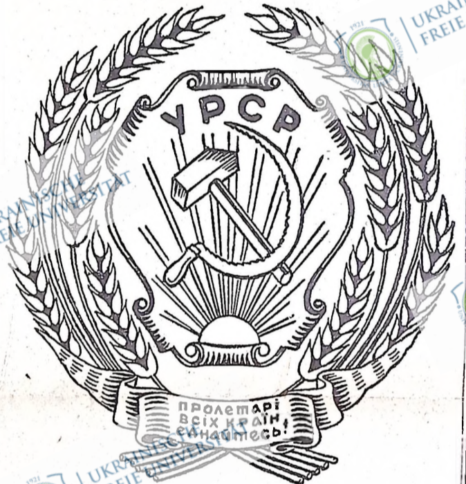
Державний герб Української Радянської Соціалістичної Республіки.

Радянська Україна видвинула нових людей. Радянська Україна пишається в сім'ї народів Радянського Союзу тим, що вона стала батьківщиною стахановського руху, руху п'ятисотениць, який вже перетво-