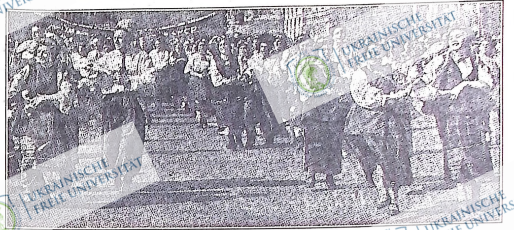
Населення Києва, столиці Радянської України, такими масовими танками радісно святкувало Першого травня вулицями Києва.