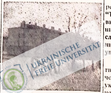
Спугет Березн Картузької.

Чи треба ще кращого свідчення для того, щоб показати, чого добилаєся урядищини для українського народу своєю гачебною службою польському фашизмові.