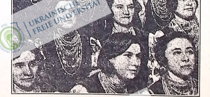
Щасливі і радісні дівчата і жінки Радянської України в прекрасних народних строях