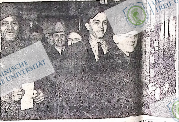
Джегерал моторс компанія кинула усе своєю машину на розбиті страйку автомобілів робітників. Вона показує такі і ті подібні картини для того, щоб перекопати громадську думку, що страйкують лише робітники-бунтівники, а лояльні робітники працюють далі. Цим вона хоче дезорганізувати боротьбу робітників. На картині — сцена однієї майстерні тієї компанії, яка не була охоплена страйком, і яку продаючи, компанія вживає для розбиття солідарності страйкарів.