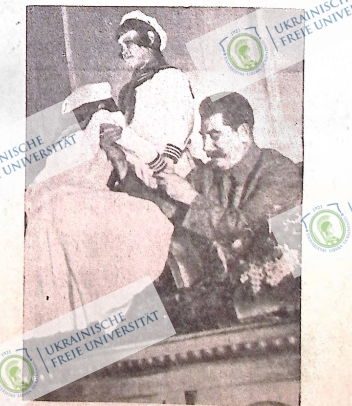
22 грудня 1936 р. Всесоюзний з'їзд жінок командного і начальницького складу Червоної армії вітала делегація дітей командирів. На знімці товариш Сталін допомагає дітям піднятися на трибуну. На трибуні стоїть Валя Шенченко, відвідаєся — Лариса Овчинникова. Як видно дітям не боїться "страшного" Сталіна. Очевидно вони не читали Герсто-вої преси та лобайівської рентиції.

Подаємо до відома усім нашим організаціям в західній Канаді, що організаційна об'їздка тов. І. Навізівського переривається 20 січня з цієї причини, що він їде до Торонто на пленум політбюро Центрального Комітету Комуністичної Партії Канади, який відбудеться з кінцем січня. Поїздка переривається на неозначений час і якщо буде відновлена, то вже по з'їздах наших організацій, які відбудуться правдоподібно з початком березня. Проситись нашій організації на заході Канади взяти це під увагу.