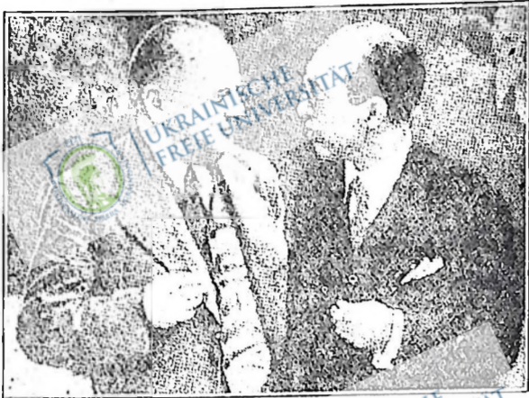
Максим Літвінов (зліва), народний комісар закордонних справ Радянського Союзу, і Теффік Рüşто Арас (зправа), турецький міністр закордонних справ, розмовляють в часі конференції в Монтро в справі протоколів.

Кілька тижнів тому відбулася в місті Монтро, Швейцарія, конференція дев'яти держав — Туреччини, Радянського Союзу, Великої Британії, Франції, Греції, Румунії, Югославії, Болгарії й Японії — в справі демілітаризації Турецького протоку, Дарданельської й Босфорської.