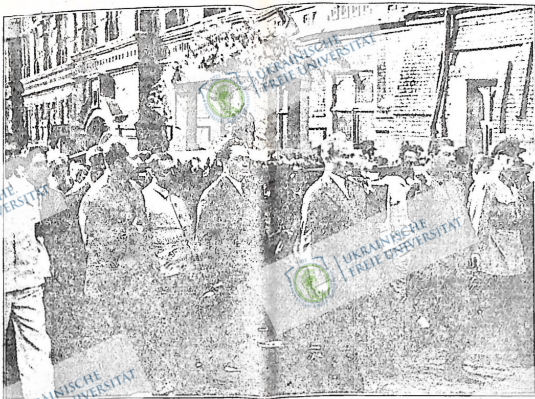
Члени уряду і партії взяли участь в похоронах Максима Горького. На ілюстрації: нести гроб з погребом спаленого тіла М. Горького (зліва на право): А. А. Жданов, Г. Дімітров, В. Молотов, Й. Сталін і Г. Г. Ягода.