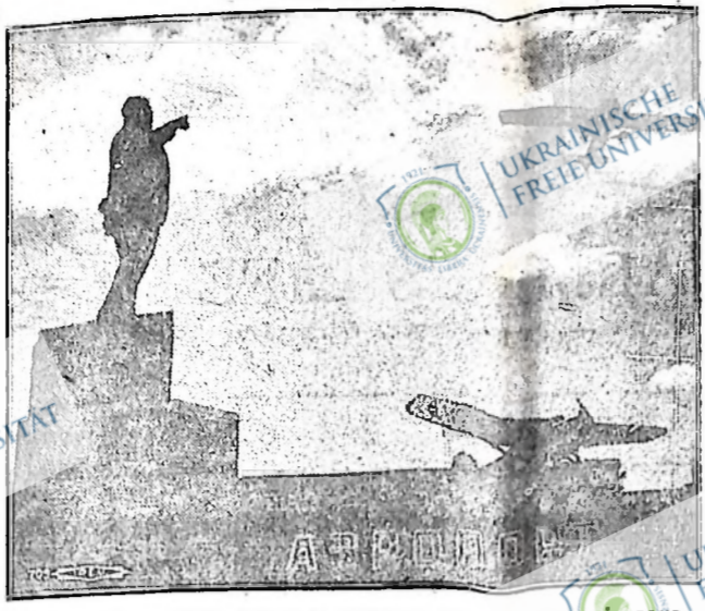
Ця знімка, взята в московському аеродромі, показує статую Леніна, яка наче вказує на величезний аероплан, що літає високо в повітрі. Останніми роками радянська авіація — військова і цивільна зробила великі поступки як в технічному удосконаленні, так і в кількості апаратів.

мерів, за яких він не жалів віддати те, що кожній людині є найдорожчим — своє життя. При цій Снігурський згадав, про щастя жертву в сумі $25 від Свідерського.