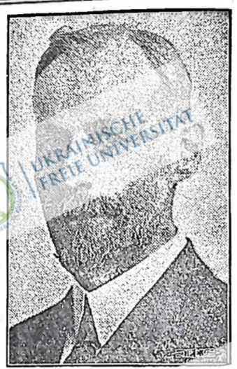
Дж. С. ВУДСВОРТ, який бореться проти єдності трудящих мас і прагне гинути на конвенції навіть своєї партії.

Вудсворт заявив, що він ненавидить ліній про єдність, яку запропонував Тим Бак і закликав делегатів не приймати резолюції, бо він вважає, що вирішувати таке питання є справою національної конвенції. Щирість тих, які на конвенції закликають до єдності, він визнає.