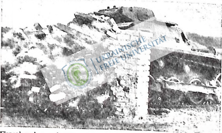
Гітлерівські воєнні танки вправляються до атаки. Танки проходять через муровану стіну так, немов вона збудована з паперу.

Вшанування роковин кривавого понеділка в Ріджайні закінчено відзначанням “Інтернаціоналу”. Учасник.