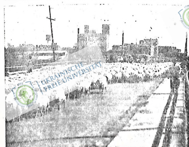
Тисячі опечі й худоби злинули шічас посухи в степи в середньо-західних степах Спол. Держав. На картині 2,500 опечі переходять міста на річці Ко в Лоренс, Кентек, вивели на нові, зелені пасовища на піщаних.

нак, не означало, що діставши реліф, фермерам не треба було битися за масове віче. Є багато важливих справ, які доконче треба обговорити. Ми не помилимося, коли скажемо, що не треба фермерам радити так легко перемогти. Пануючий клас з розрахунком зробив цей крок, щоб перекопати, чи ми готові кожнораз боротися за свої інтереси. Багато фермерів, які домагалися скликання віча, на віче не прийшли. Вони вдовольнилися маленьким. Помимо того віче відбулося, на якому вбрано делегацию, що має іти до муніципальних рад Піброк і Таватінов і предложити їм домагаання фермерів за підвижку платні за роботу на дорогах з 25 ц. до 35 ц. на годину. Крім того фермери домагаються, щоб за реліф відробляли не більше 30%, коли муніципальні ради примушують фермерів відробляти реліф на 100%. Такі домагаання фермерів предложить муніципальним радам фермерська делегация. Це є слушні домагаання і всі фермери повинні боротися за їхнє здійснення. Настав час, коли фермери повинні творити єдиний фронт і спільно боротися за свої конечні життєві потреби. 9 серпня відбудеться масовий мітинг, на якому делегация здасть звіт, як прийняли її муніципальні ради в Піброк і Товатіно. Прийдіть всі на цей масовий мітинг. М. Костюк.