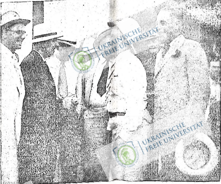
Говорючий Том Беррі з Норт Дакоти (в білій сорочці) вітається з Рексфордом Тугвелом (зправа) з Бисмарк, який приїхав студіювати посушливе положення в штаті Норт Дакоти. Тугвел сказав, що федеральний уряд переселить тисячі фермерських родин з посушливих скеліць.

ста, бо не можуть переїхати кінцями по мочарах і великих потоках. Тепер фермери Піс Риверу переконалися, що уряд задурив їх, аби тільки заселити ними пісриверські пуші. Коли вони домагаються від уряду дорог, то уряд завжди каже, що нема грошей. В той сам час канадський уряд витрачає мільйони доларів річковою військовою підготовкою. Шкоди кінцями наших сніди на гарматне м'ясо. Як би так сьогодні вибухла нова війна, то канадський уряд мав би подостатком грошей на величезні воєнні видатки. Чому воно так, що канадський уряд "не має" грошей на дороги в Піс Ривер, які він обіцяв, а має подостатком грошей на воєнні приготування? А тому, що це капіталістичний уряд і робить те, що йому капіталісти диктують. А капіталісти диктують йому приготуватися до нової війни, бо на війні вони роблять шалені гроші. Що їм там якісь фермери в Піс Ривері! Хай топляться в болотах і мочарах. Який вихід з цього положення? Творити єдиний фронт і боротися не лиш за відповідні дороги, але й проти воєнної небезпеки і фашизму. Я. Сенюта.