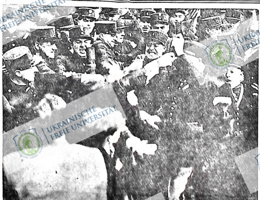
В день всенародного свята "Ураку Баєтний" французькі фашисти пробували влаштувати, вупереч забороні уряду, свою демонстрацію. Хоч їх збралося цин "розатане" штерних фашистів.

Едмонтон, Алта., 23 липня. — "Не Рівер дистрикт Альберти є природною і невіддільною частиною провінції, і повинен залишитися такою", заявив прем'єр Абергарт. Коментуючи знідомлення з півночі, що мешканці тієї території розпочали рух за відірванням від Альберти і за встановленням своєї власної генеральної ради з п'ятих осіб, Абергарт сказав: "Я не вірю, що відірвання принесе будь-яку користь жодній частині провінції. Воно тільки може створити новий уряд і нові витрати. Рівер не дав теперішньому урядові достатньо часу для наладнання справ".