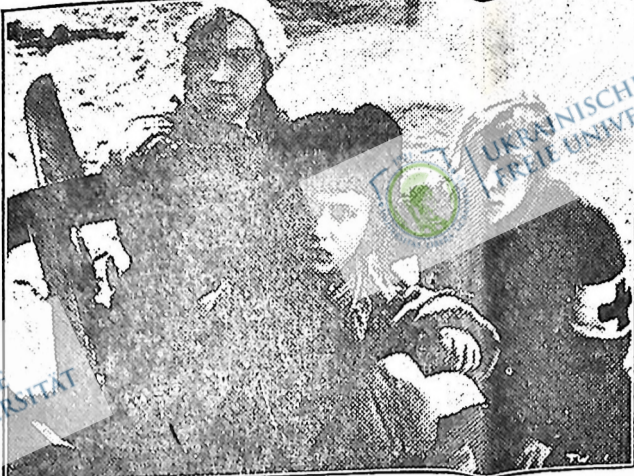
"ТРИ ЖІНКИ" на фронті з Червоною армією підчас громадянських всен в 1919 році.

Товариші! Відновляйте передплату на "Фарм. Життя"!