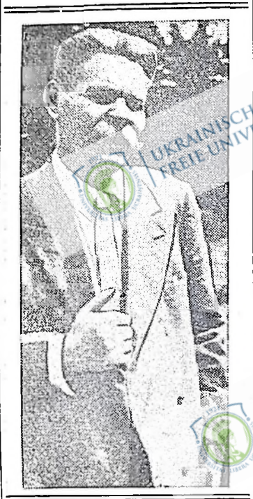
Максим Горький належить до тих велетнів, яких людство віддигає тільки в певних періодах.

Максим Горький завжди до старшого, але переджовтисвого революційного покоління письменників, твори якого читало та на яких виховувалося тогочасне й теперішнє молоде покоління.