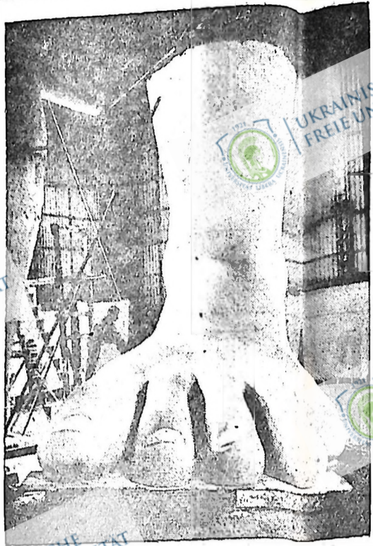
Це статуя висоти 250 футової статуї Л. Дуче, яку мають збудувати в його честь за “світлізування” Етіопії газамі, бомбами та багнетами. Італійські антифашисти клять, що статуя буде стояти на фундаменті з глини.

Масте ратію, далекий шани! Чувши. Це робота місцевих дивуни, які доводять задолжених богом, але не боятися божою карою, коли багачи помістяться на своїх противни-