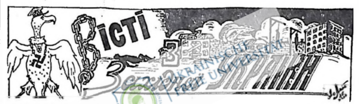
ЧОТИРИ САМОГУБСТВА ЗА ДОБУ