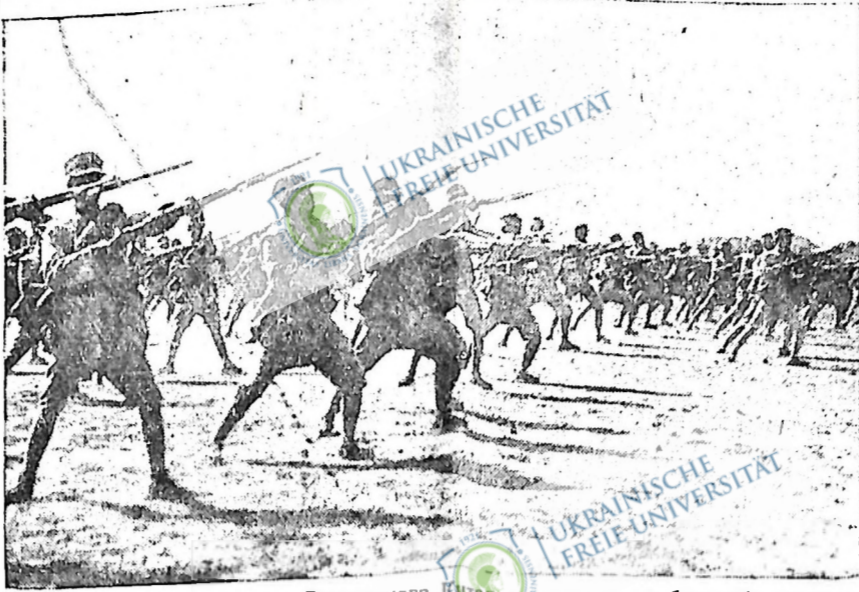
Південний уряд і уряд Радяньского Китаю закликають до боротьби проти японських імперіалістів. На картині — армія Чан Кай-ші, довголітнього гнібителя китайського народу, яка стримує визвольну боротьбу китайських мас. Ген. Чан Кай-ші відмовився ставити опір японським грабникам і вислав свої війська на південь, щоб стримати наступ армії південного уряду.

радіний муніципалу Грент віс, а Василь Стефанюк, радіний муніципалу Бейн підтримав резолюцію такого змісту: “Що цей масовий мітинг фермерів муніципалітету Грент і Бейн прийшов до рішення, що уряд не повинен давати дальших концесій на форкложур, поки на не цагадуть згоди муніципалітету ради.” “А далі хай буде рішення, що цей мітинг подякує е проти назначення професіональних людей, таких як адвокати, лікарі і їм подібні, урядниками до установ залагодження довгів: на нашу думку фермери, які розуміють положення своїх братів фермерів, повинні бути урядниками цих установ для залагодження довгів.” Дальша резолюція, яку виніс ріф Гоган, підтримав ріф Кондра, звучить: “Що муніципалітету Грент і Бейн є готові залагодити залеглі податки до такої пропорції, до якої превініональний уряд залагодить приватні довги фермерів.” Зроблено й прийнято високі, щоб копії цих резолюцій вислати до домініальних послів В. А. Токера і д-ра Б. Р. Флеминга, прем’єра Кінга, провініонального міністра здоров’я д-ра Юрка, превініонального посла д-ра Дж. С. Кінга і до саскечеванського прем’єра Петерсона.