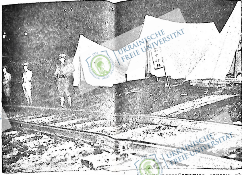
На картині — війська японського імперіалізму розтаборилися вздовж північно-манчжурської залізничної лінії на Далекому Сході, недалеко того місця, де японська воєначина робила наскоки на радянську територію. Але червоноармії дали завжди японським грабникам несподівану відсіч.