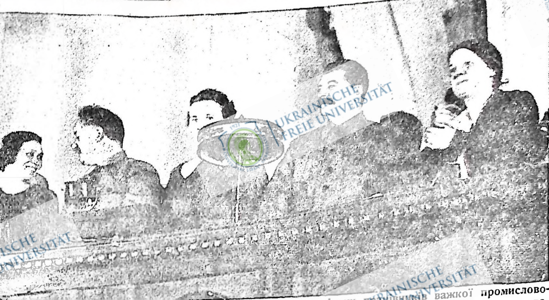
Всесоюзна нарада дружин господарників і інженерно-технічних працівників важкої промисловості, яка відбулася в середині травня в Москві, та на якій зготовлено план боротьби за культуру, рабське життя, піднесення виробництва — за соціалізм. На цій нараді були також провідники-жінки промисловості — важкої, будівництва, шахтарської й інших. На картині — члени президії наради, а між ними т.т. Сталін, генеральний секретар ВКП(б), і Орджонікідзе, народний комісар важкої промисловості.

Трудящі Манітоби можуть частинно подізнати своє життя надходящими виборами. В який спосіб? В той спосіб, що фармерських кандидатів: комуністичних, сїєцифічних і едшо-лющих Іспанії й Франції, які об'єдналися в національний фронт й утворили такі уряди, які обіцяли дати селянським і полетарським робітникам, які обіцяли боротися проти війни й фа-