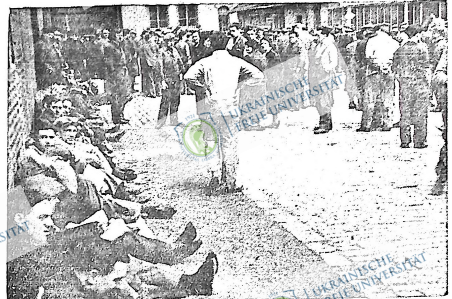
Мільйон французьких робітників страйковою боротьбою здобули коротші години праці і підвишку платні. Уряд народного фронту підтримував їхню боротьбу. На картині — робітники в часі окупаційного страйку в одній із паризьких фабрик.

Одна фермерська родина хотіла повернутися жити на фарму, але не могла цього зробити. Цей бувший фермер бачився в цій справі з прем'єром провінції, а пізніше отримав від нього лист, де було сказано, що "не можна дати ніякої допомоги тим родинам, які бажать вернутися на фарми з тієї причини, що в 1932, 1933 і 1934 роках уряд пробував помагати в цій справі... В теперішню пору на півночі є по верх 7,000 поселенців на реліфі і я не бачу великої користі з того, щоб збільшувати їхні ряди дальшим висланям з міста на фарми. Можливо, що цей план мав би певну користь, як би він мав на меті помагати таким особам, як ви, які мають практичний досвід в фермеруванні і мають у виду місцевість, де вони можуть поселитися з виглядом на негайний успіх".