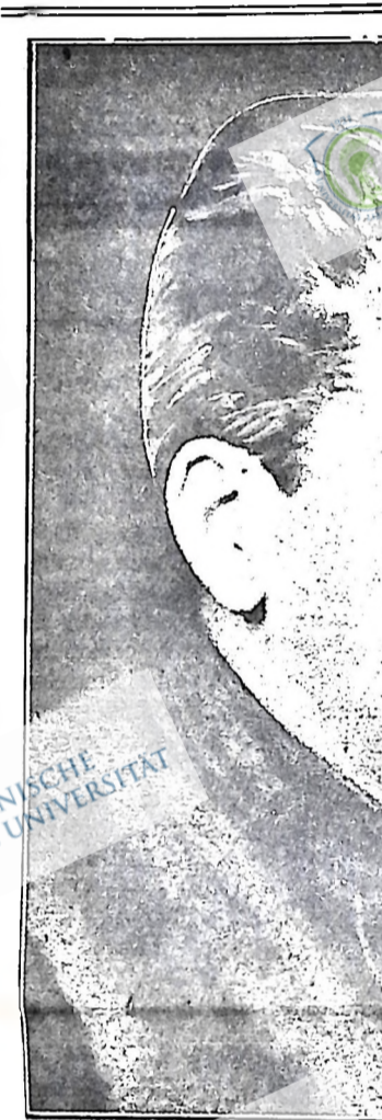
І. В. Сталін

вачів “Правди”. Ось Сталін, щойно повернувшись з далекого заслання, захищає ленінську лінію на квітневій конференції, на VI з’їзді партії в серпні 1917 року. Нарешті Велика пролетарська революція, безмірна роль у ній пориша Сталіна відомо кожному трудящому у на передодні якої, за словами тов. Калініна — “Сталін — один з тих небагатьох, разом з якими Ленін вирішує питання про повстання, конспіруючи це від Зінов’єва і Каменева, тодішніх членів ЦК”.