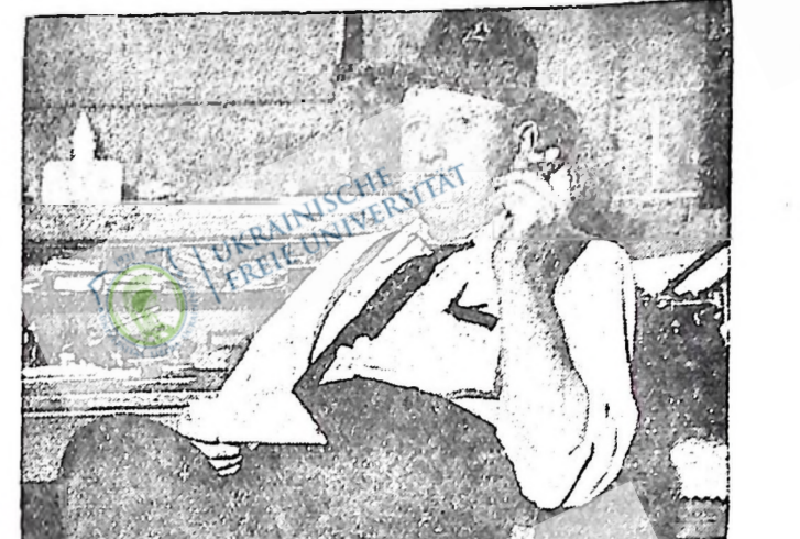
На фотографії бачимо В. Ф. Еффінгера, головного провідника Чорного Легіону, що має свої дії в Огайо, Індіана і Мішиген, Сполучених Держав. Він фашистський бандит, вбивають організаторів робітничих об'їд в Спо.л. Державах, комуністів і католиків. Останніми часами арештовано й поставлено на суд кількадесть членів цієї банди за мордерство й терор. Але Еффінгер заявив, що Чорний Легіон буде продовжувати свою роботу "в користь Америкі і американських громадян".

В деяких місцевостях появилися коники (сарана), але проти них підприємто відповідної міри і шкоди від них є незначні. Пасовиська і сіножаті потерпіли дещо в останньому тижні. В південній і центральній околицях степових провінцій треба негайно доброго дощу, щобі направив ту шкоду, яку заподіяла посуха і спека в останньому тижні. Якщо його не буде, то засіви потерплять дуже багато.