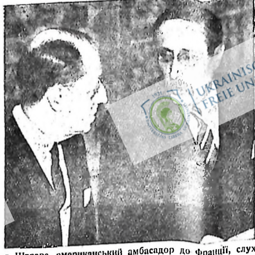
Індор Штрава, американський посол до Франції, слухає з зацікавленням, як Леон Блум, провідник соціалістичної партії і прем'єр Франції, пояснює план Народного Форту щодо міжнародного положення. Він сказав, що французький народ є рішуче за припинення активності фашистів та за обмеження прав і дій банкірів і фабрикантів зброї.

Серед таких "гараздів" застала фармерів нова зима. Прекрасні врожай не приніс ім сподіваної користі. Все працю загарбали п'явки, яких не дунали руки коло тяжкої праці на фармі, яких не кололо в боці від того, що їх патріста жині парка по ямах і камінь, яких не дунала в криках від того, що вони шуфлювали пшеницю з поля до шпихлірів під час холодення, яких не касали очі від недосваних ночей. На сторулі інтересів цих п'явок стоїть панські закони, які дозволяють різним п'явкам точити зрон з фармерів, доки доміє кров в пошнє іти чиста вода з їх "заступності" фармерам "заробити самі в себе". Так само і в цьому разі з фармерами, так оно є сподівано і так оно буде навіть, якщо фармери