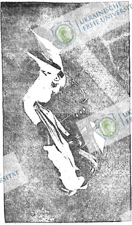
Фотографія представляє славного англійського парашутиста Клема Сола, який спускається 3,000 фітів стрімголов в долину. Спускаючись при допомозі парашута в долину, Сол мало що не пожив смертю, від якої врятувало його те, що парашут якраз на час отворився і зачепив дерево саме тоді, коли Сол мав властні на землю і влітисся.