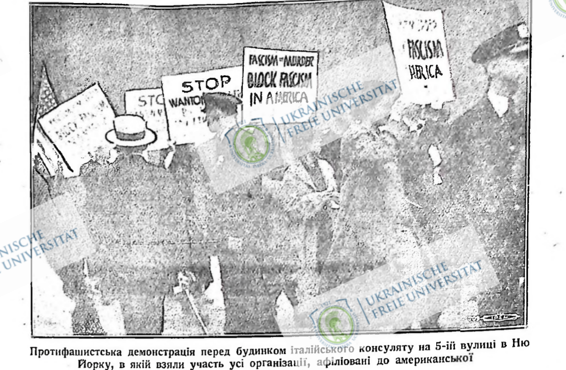
Протифашистська демонстрація перед будинком італійського консульства на 5-ій вулиці в Нью Йорку, в якій взяли участь усі організації, афілійовані до американської Ліги проти війни і фашизму.

Монтреал, Кве. — Конгрес канадських євреїв, що відбувся тут минулого тижня, постановив «підтримувати всі міри, які мають за ціль повністю бойкоту імцєцьких товарів». Таку резолюцію прийнято на останній сесії цього річного конгресу.