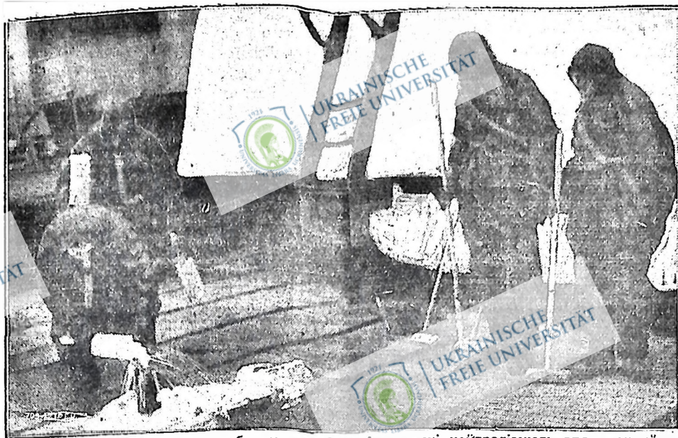
Радянські моряки випробовують нові хемікалі, які нейтралізують вплив отруйливого газу, киненого ворожими літаками. На картині — залоза на палубі воєнного парохода, вбрана у спеціальний одяг, що не пропускає повітря, поливає палубу хемікалі, щоб убити ефект отруйливого газу, який осідає на палубі.

"Фарм. Життя" служить нашим інтересам. Служить йому в мірних і мирних і забезпечить його майбутнє існування. Це є у нашій власній інтересі.