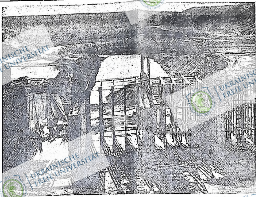
У вузькій долині ріки Гомболт, в стейті Невада, американський уряд розпочав будову греблі для наводнення посушливих земель, які на протязі кількох років не принесли майже жодної користі. Такі греблі для наводнення землі американський уряд будує в різних посушливих стейтах Сполучених Держав.