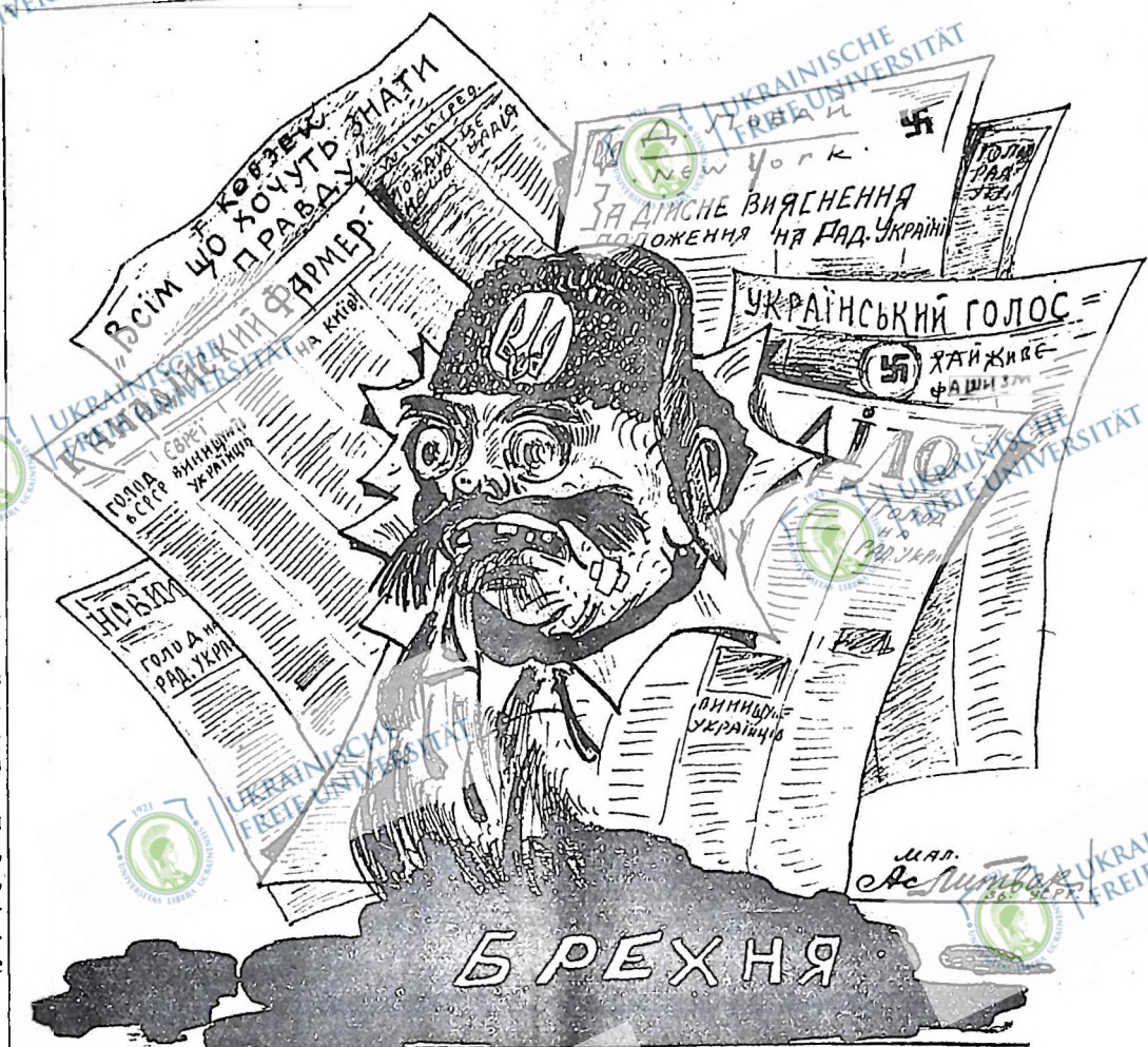
ОБЛИЧЧЯ УКРАЇНСЬКОЇ КОНТРРЕВОЛЮЦІЙНОЇ ПРЕСИ

Для Радянського Союзу і Радянської України зокрема, давно відомо, що всі націоналістично-контрреволюційна преса, починаючи від буржуазного ундо-фашистського "Діло" і кінчаючи клерикально-фашистським органом "Канад- ський Фермер", весь час запо- штують своїми паклетами на українців, підковертуючи на Україні і т. д., пропихуючи крокодиличі са-