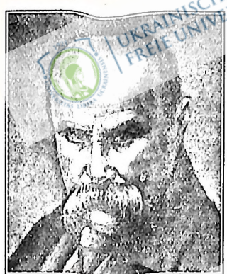
Народився 10 березня 1814 р. помер 11 березня 1861 р.

11 березня минає 75 років часу від дня смерті великого українського поета-революціонера Тараса Шевченка.