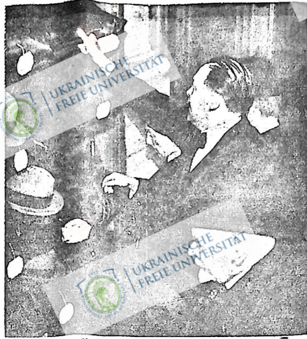
Джін Фарбі (без шапки) й Марсель Рейніе, члени французького уряду Лавалля, забирають свої шапки після того, як в парламенті ухвалено недовіря до уряду Лавалля за його політику рятівництва Муссоліні коштом віддання йому Етіопії (відомий план Гора — Лавалля).

З цим питанням щільно зв'язане друге. Відділи, округи, м. і провокми, та й центр, повинні серйозніше ставитися до питання висування нових провідних кадрів. І це висування не повинно бути випадковою річчю, але цілком нормальною, систематичною. Якщо ми так справу поставимо, то не то що покращимо усе наше керівництво, але далеко вперед посунемо цілу нашу організацію. Висуваючи нові кадри, ми повинні берегти старі, використовуючи їхній досвід. Вся організація повинна повернути лицем на допомогу і боротьбу за виховання нових кадрів і за збереження старих. В цій боротьбі за виховання нових кадрів ми повинні якнайкраще навчитися розставляти свої сили так — щоб кожного чи кожну поставити на відповідному місці. Треба пам'ятати, що боротьба за добрі кадри — це боротьба за сильну й здорову, гнучку й боездатну організацію.