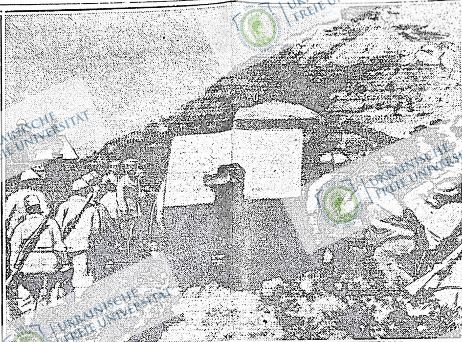
Картина виявляє, яку "цивілізацію" несе італійська фашистська армія етіопцям. Ця картина знято на полі війни в Африці, перевезено літаком до Італії, передано по телефону до Лондону, а звідтам по радіо до Нью Йорку. Танка, яку видно на картині, є одна з багатьох, що їх італійська армія вживала в часі наступу на Адову.