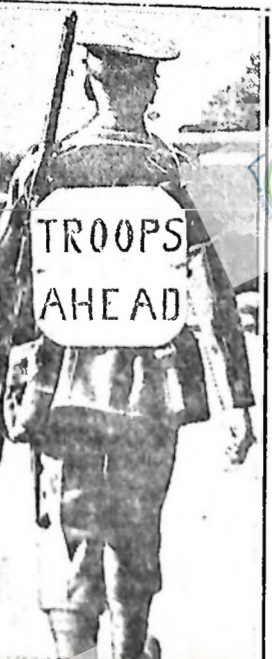
Вибухла війна і мільйони солдатів вирушили на фронт, щоб там виставити наші інтереси.