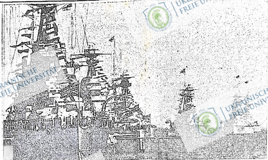
Ескадри сильно озброєних британських воєнних пароплавів пливають в Середземне море, яке вже заповнене воєнними пароплавами імпералістичних країн. Становище таке напружене, що мада іскра може спричинити нову світову війну.