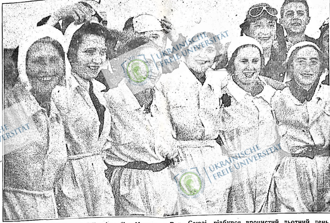
На просторій площі Тушіно, біля Москви, в Рад. Союзі, відбувся вчорашній льотний день. Тисячі робітників і робітниць приглядалися, як молоді парашутисти стрибали з висоти 3,000 метрів у долину з роздуваними парашутами. Як видно на цій фотознімці, то цей гурт молодих парашутистів у хоршому, веселому настрою, повні здоров'я і сили.