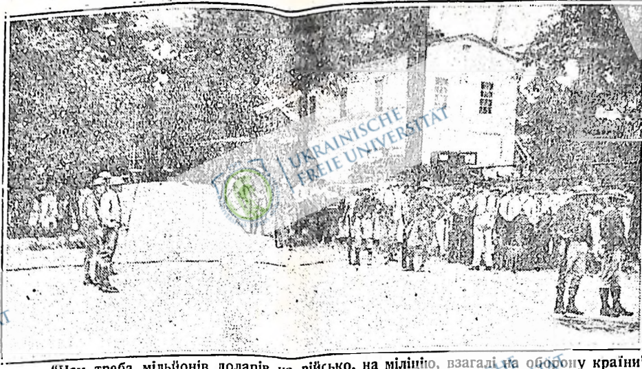
"Нам треба мільйонів доларів на військо, на міліцію, взагалі на оборону країни" — заявляють володарі американської держави. Для яких цілей збирається збройні сили цієї країни — найкраще можна бачити з того куди саме ці гроші направляються. Ось не встигла влада стейту Савт Каролайна відтягнути міліцію з містечка Пелзер, де робітники Пелзер Менюфактурінг Ко. страйкують від кількох тижнів, а вже знов спроваджено міліцію. Ці озброєні сили "демократичної держави" з багнетами в руках охороняють інтереси згаданого підприємства, цебо — як каже влада — держать "порядок". В цій державі "порядку" загинув один робітник і двадцять два покалічені. Так держать "порядок" озброєні сили. Так "охороняють інтереси народу". Ось для чого потрібні озброєні сили.

Соціалізм остаточно зверне канадський народ проти всього багатства країни, яке до нього завезли. Але теперішній ви-