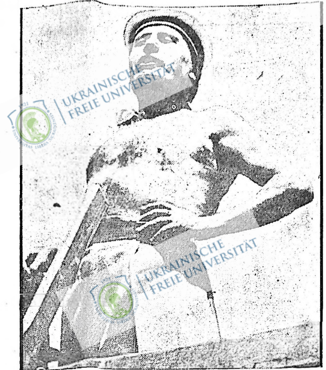
Муссоліні, щоб показати себе фермером, скинув сорочку і через кілька хвилин помагав селянам в молочній. Після цього агітував італійських селян ростити більше збіжжя, щоб був хліб для війська у війні проти Етіопії.

Нас комуністів, говорив кандидат, пані дуже ненавидить й мають причину ненавидіти нас, але найважливішою причиною не мають знаходити нас ті, за інтереси яких ми боросямося. І ці останні відносяться до нас єдині патріоти "оїчизни". Між ними е один, що дуже хоче бути "королем" і преться на публічності, мають до комуністів довіру, бо вони люблять, як десетки тисяч комуністів, а інших капіталістичних паразитів темлять е в нормальні класи, що стали в обороні покриваються й відкидають нас. Десятки тисяч комуністів в капіталістичних державах віддали й віддають своє життя, але кожний людині май дорожче за те, щоб трудящі маси не голодували, щоб вони мали відповідне життя, щоб їх не спалили на вогні за капіталістичні інтереси.