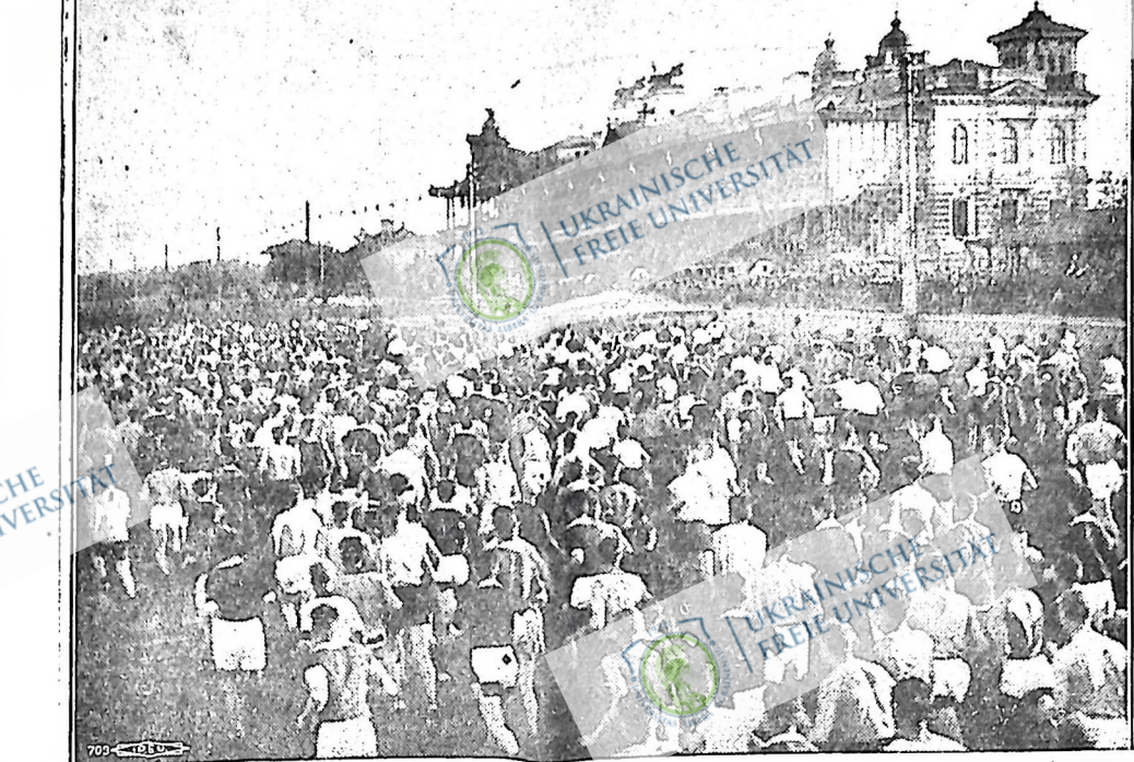
Тисячі атлетів з усього Радянського Союзу прибули на спортивне змагання в Москві. Між ними атлетами є червоноармійці, робітники, селяни з кол господар і студенти. На цій фотознімці видно перегони у скорому бігу на віддалі 5,000 метрів.