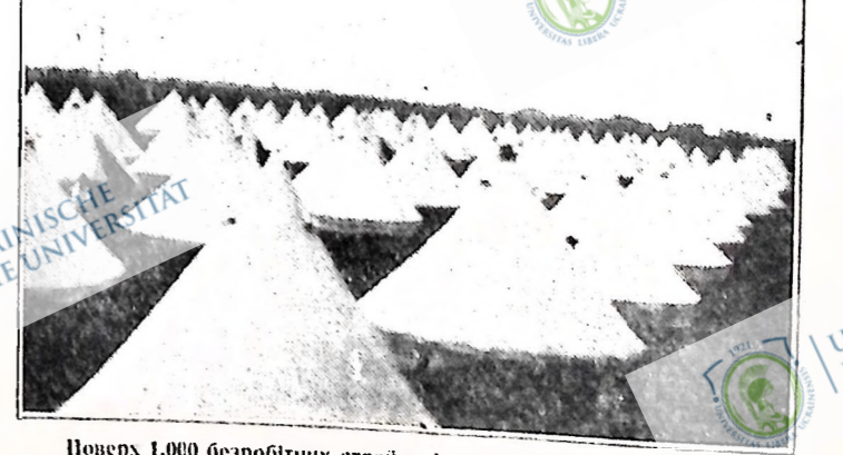
Повище 1,000 безробітних страйкарів манітобських релігійних комітєв розли в уряд за сотною целью та отаборилися на військовий нарієнь і місто. Їхні передава стєна виїхала вже на схід, але її не дають покинути місто і шляху до Кензеса далі.