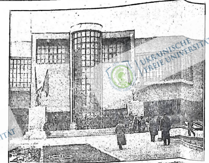
Новий спортивний клуб фабрики авіопланів Тсолов'яну, який відкрито недавно в Москві. В капіталістичних країнах дещо бода мають такі клуби, а в Рад. Союзі вони належать робітникам.

Другий мітинг соціал-кре дитів відбувся в Стрімставі. Фармерів було багато. Кожний хотів дістати $25, бо в деяких околицях тільки балакають про 25-доларові дарунки. В тій місцевості був консь евідділ ЛФБ, але розпався. Пра вда, що є тут багато симпати ків бойового руху, які чомусь не хочуть працювати для орга нізації. Все таке є надія, що ті симпатичні стануть консь ширими працівниками і членами організації, тільки треба в тій місцевості зорганізувати відділ робітничо-фармерської орга нізації. Д. П.