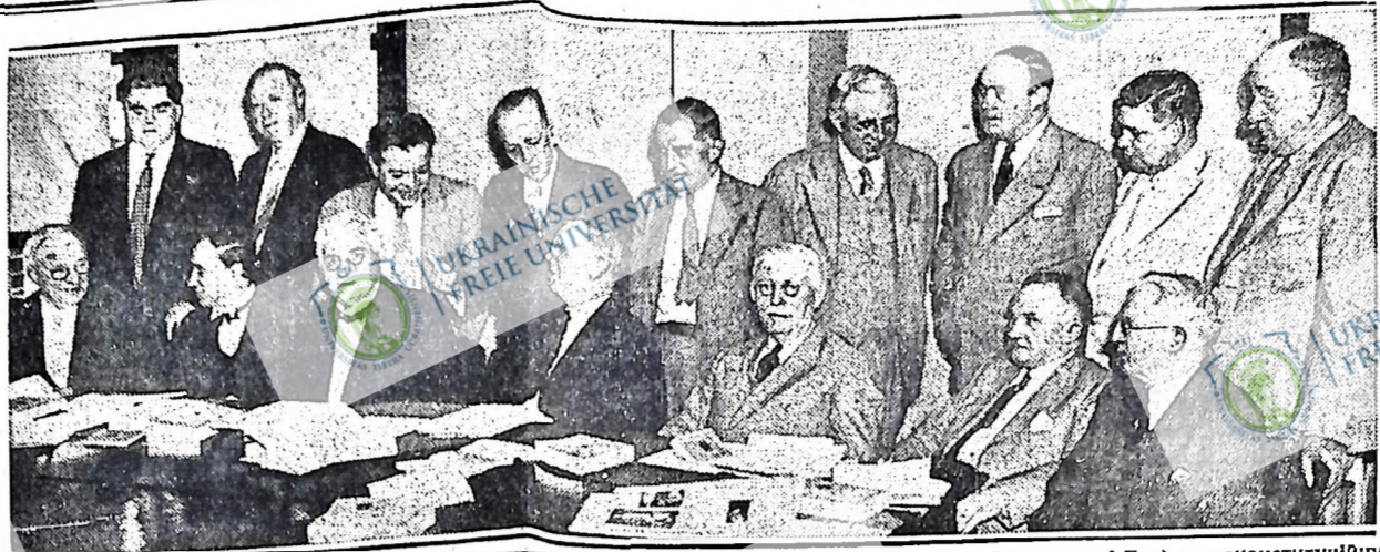
Найвищий суд в Сполучених Державах визнає адміністраційну програму НРА (Найшинал Реквері Ект) за неконституційну. У цій справі Екзекутивна Рада Американської Федерації Праці (яку видно на лівій фотографії) рекомендує поправку до конституції, що забезпечила б на майбутнє соціальне і економічне законодавство. Цю акцію Екзекутивної Ради АФП одобрили прогресивні члени Конгресу.

Либеральна партія рішила на своїх кокусі (нарадах) виступити проти Бенетового законопроекту. Либерали так само не піддають нічого конкретного, щоб вийти з теперішнього на кризу в Канаді.