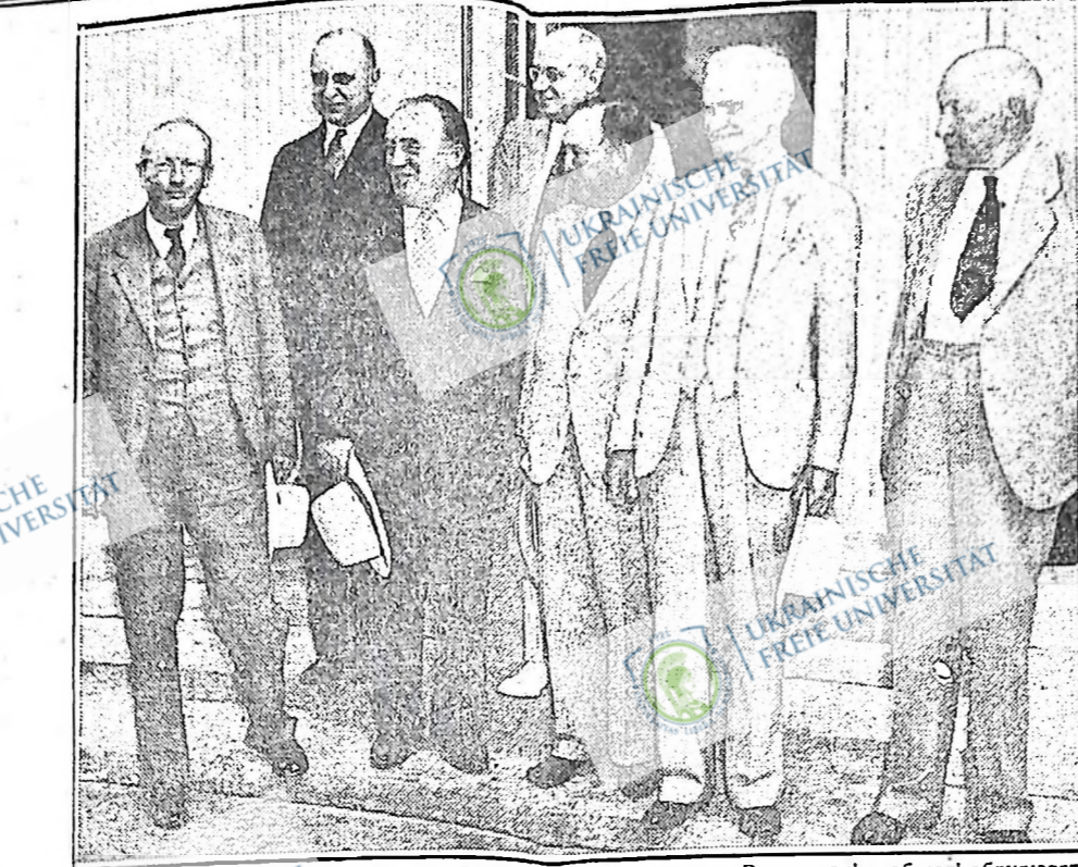
План нового доброго обслугованого "шо діл" підготовлено в Вашингтоні, щоб далі обдурувати американських робітників. Учасниками конференції у виробленні нових планів "шо діл" були: сенатор Пет Гарисон, ген. проку рор Рід, конгресмен Дж. Дж. О'Конор, прокурор Кемпбелл, сенатор Дж. Робінсон, спікер конгресу Бірнс, конгресмен Ботон.

Минуло других п'ять років часу без ніякої зміни на ліпше. Тоді багато з нас прийшло до переконання, що з так званим "нашим фермерським" урядом поєт не тее. Однак, коли промовці від ЮФА розіхалися по фазмах і поробили нам білий дефінітивні обіжники, ми рішили дати ще одну нагоду "нашому" урядові, беручи на увагу те, що все така ЮФА була в той час найбільш радикальна партія серед фермерів. І знову ми прийшли до перетонання, бо не могли шти роки урядування