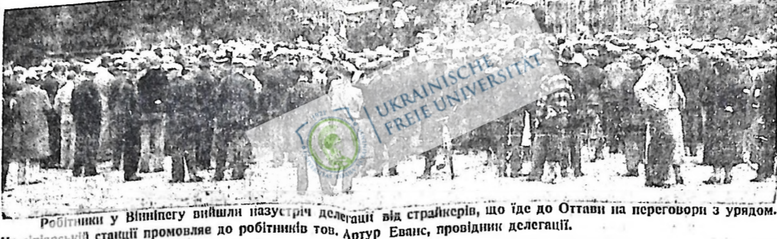
Робітники у Вінніпегу вийшли назустріч делегації від страйкарів, що їде до Оттави на переговори з урядом. На сніпартській станції промовляв до робітників тов. Артур Еванс, провідник делегації.

"Ви брехун — гукнув Еванс до Бенета, — ці гроші взято, щоб дати поживу голодуючим майнерам, замість заслати до в'язниці в'язнів у Індіана-поліс." "Я розкажу народові Канади, що я мусів назвати прем'єра-міністра брехуном!" — сказав Еванс Бенетові і плетом урядові. Тут Бенет затрощив Евансові, що коли підпаде закон, то знову опиниться в тюрмі. (Артур Еванс відсидів два роки в тюрмі за комуністичну пропаганду, засуджений на основі 98 секції карного закону). Ріджайна, Саск., 25 червня. — Комітет робітників невірних кемпів Бритіш Колумбії і Алберти, що чекають в Ріджайні на поворот своєї делегації з Оттави, видав інструкції страйкарям бути готовим кожної хвилини продовжати похід на Оттаву. Учасники походу на Оттаву влаштували тут парад і масовий мітинг, але ніяких дефінівних планів не проголошено, чекаючи на поворот делегації з Оттави. Загальна опінія страйкарів є, що похід на Оттаву буде продовжатися.