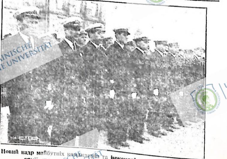
Новий кадр майбутніх кандидатів та інженерів радянської Червоної армії, що в дні 4-го червня закінчили початковий курс військової академії в Москві.