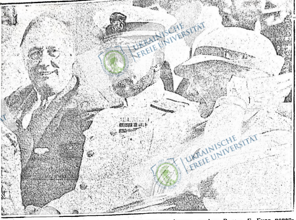
В той сам час, коли ФЕРА висилає шерти сухі до Аласки, адмірал Ричард Е. Бирд повер-тає до Ватингтона з холодних пустарів Антарктику. Зі своєю матрією і президентом Рузвельтом по-бачив Бирд ще на самім переді походу вулицями столичного міста.