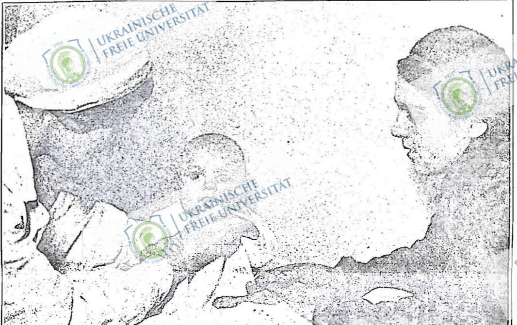
В дитячих яслах радянські діти мають належну опіку. На фото: лікарня оглядає нового мешканця ясел.

У своїй діяльності ревізійна комісія підзвітна загальним зборам членів артіль.