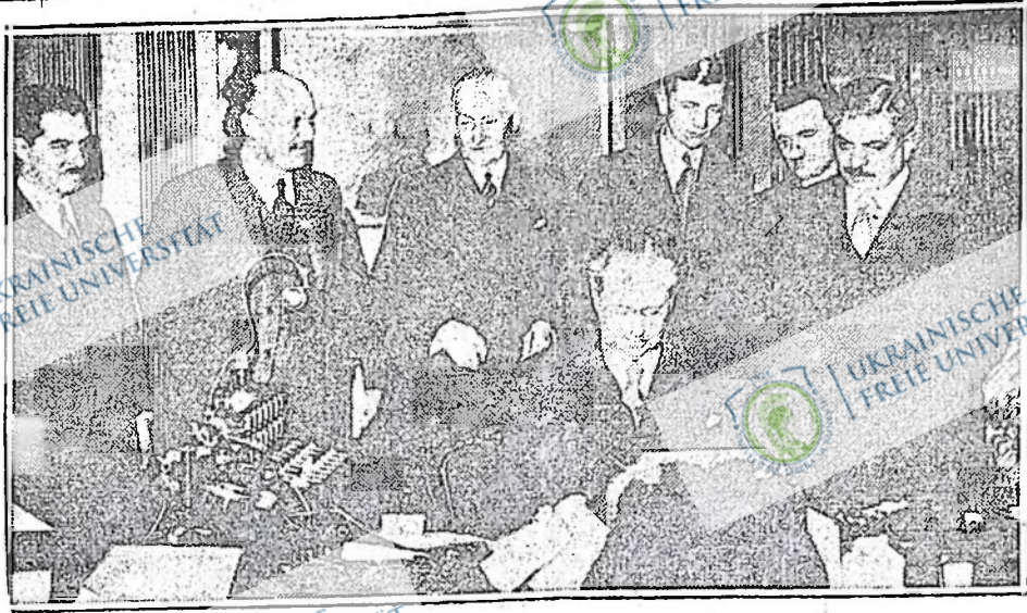
Володимир Потьомкін, радянський амбасадор, підписує в Парижі франко-радянський пакт взаємної допомоги. Зліва стоїть П'єр Лаваль, французький міністер закордонних справ. Тепер цей пакт, який ще одним — радянсько-чеським пактом взаємної допомоги, стає могутньою зброєю боротьби за мир в цілій Європі.