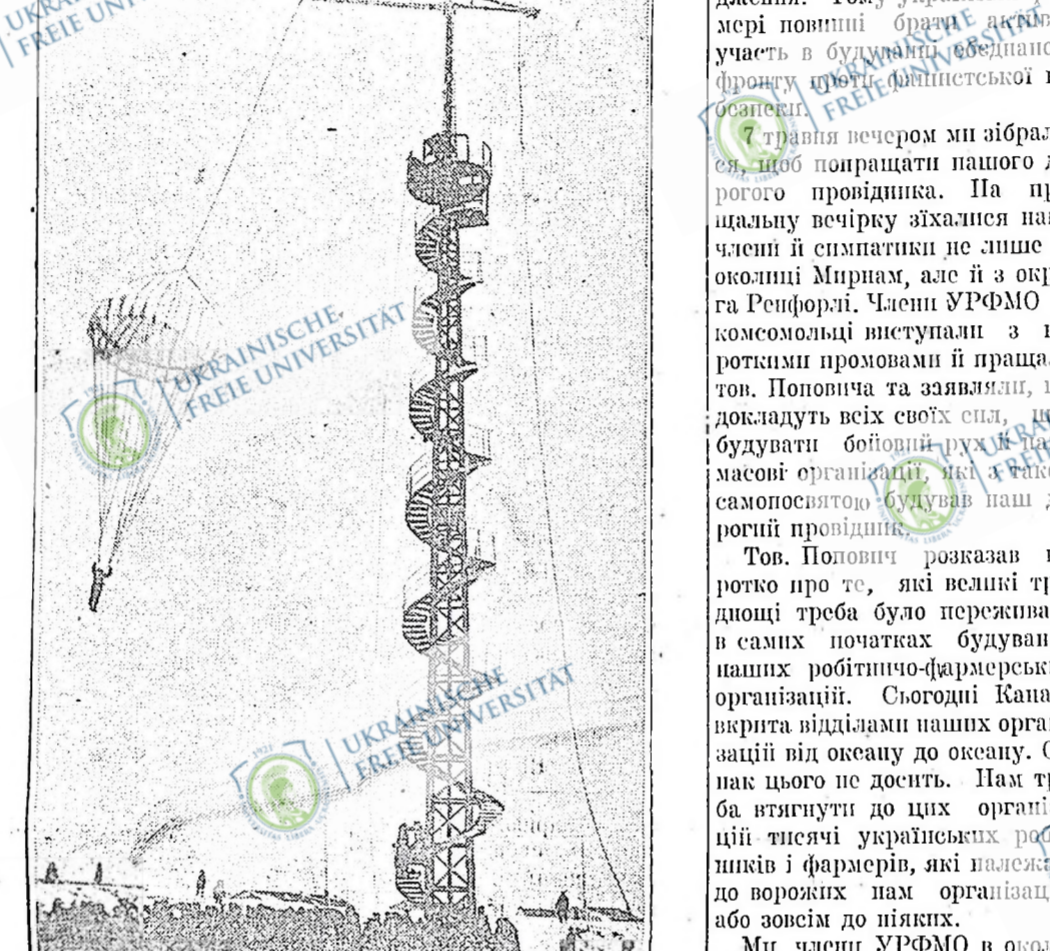
Паращутний спорт популярний і на рад. Україні

Як би так дороги були в кращій стані, то на першотравневий свят в Мирнам було би кілька тисяч фармерів, щоб