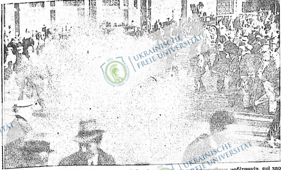
Поліція в Омага, Небреска, кидає газові бомби в страйкову чергу трамвайних робітників, які зводять боротьбу з страйколом на пікетній лінії.

Сокаль, Саскачеван. Недавно відбулися в нас вибори до шкільної ради. На кандидатів виставлено твердого католика з однієї сторони і класово свідомого фермера з другої.