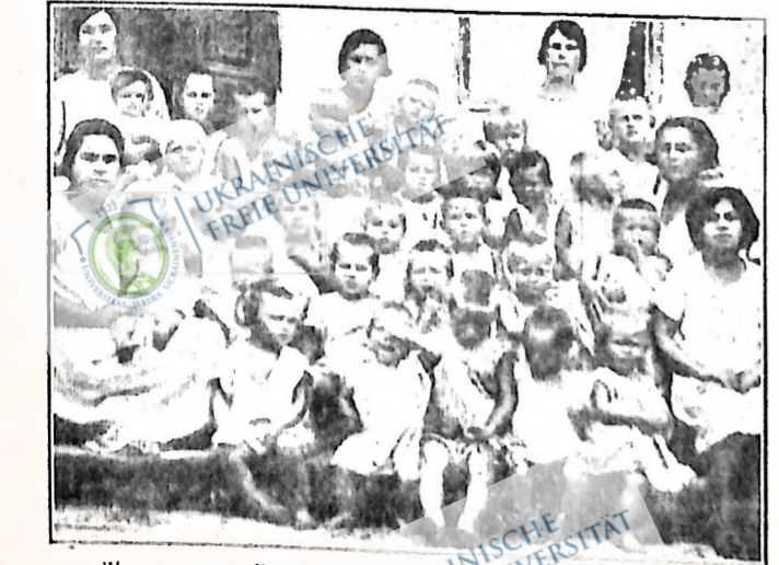
Діти трудящих Рад. України відпочивають в дїтячій кімнаті.

Проте на Радянській Україні дітям показують фільми не так, щоб лише показати. При показуванні дітям фільмів були педагоги, були батьки дітей. Це показування посилює велике культурне значення, воно перетворилося на джерело дальшого піднесення і дїточого навчання й піднесення якості дїтячих кінотеатрів.