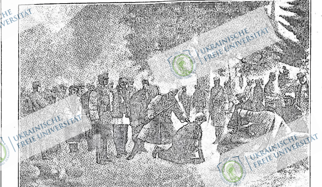
Ундірщина, соціял-фашисти, ОУН — всі вони тепер спільно працюють з польським фашизмом для того, щоб шнунти Західну і Радянську Україну в нову піліну та принести трудящим знову отані польові суди та вкрити шибеницями землі України. — Розчавити фашистську гадину!