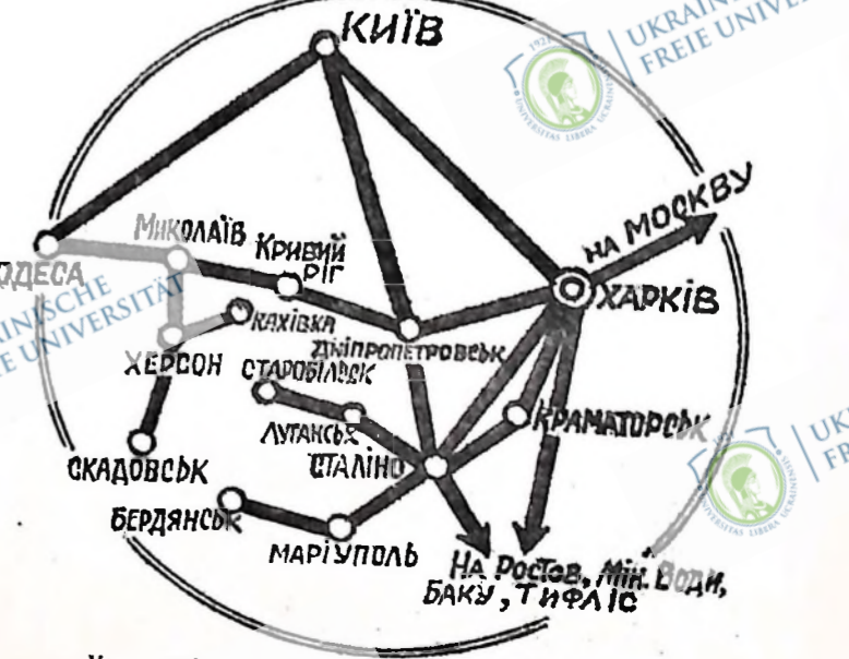
Карта повітряного сполучення на Радянській Україні.