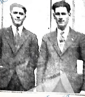
Секесеканські делегати на з'їзді УРФМО.

Помогайте, товариші й товаришки, ми цей зворот робили тільки завдяки ідеологічному проводу комуністичної партії, завдяки нашій боротьбі з національною окремішністю, з правими й «лівацькими» ухилами, завдяки пухлякому