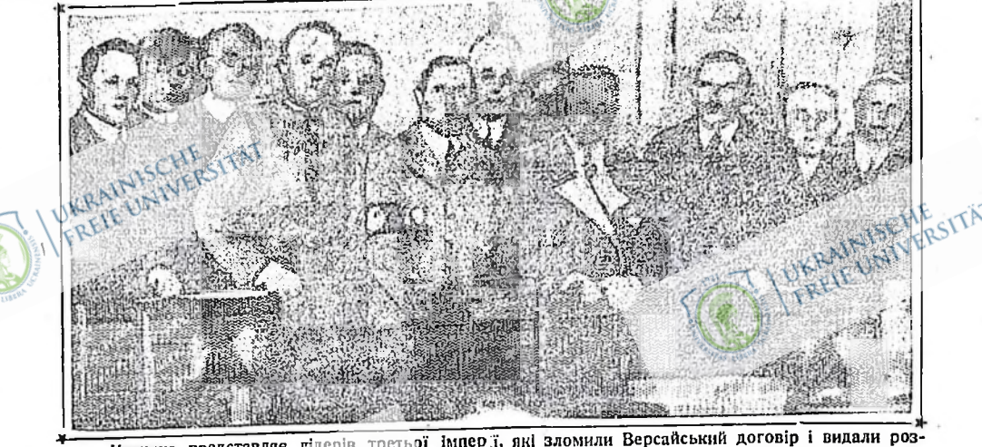
Картина представляє лідерів третьої імперії, які зломали Версайський договір і видали розпорядження змобілізувати 600,000 армію для збереження фашистської Німеччини для капіталістів. По їх думці вже все готове, лише стріляти, але цього буде досить. Німецьким робітникам треба лише знати кого стріляти.