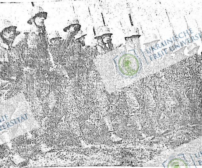
Фашистська армія Німеччини готова до війни. Німецькі імперіалісти прагнуть нових колоній і тому пруть усією силою до війни, щоб захопити нові краї і заволати інші народи. Гітлерівські бандити у війні шукають виходу з кризи, щоб на воєнних фронтах вимордувати ті мільйони голодних робітників, яких сьогодні повно у фашистській Німеччині й по інших капіталістичних країнах.

Видне згадані члені тепер еміються, що наш кандидат переміг. Як таку роботу погодити з програмою Ліги Фармерської Єдності, що хіба вони можуть, пояснити. Показемо два роки і наш кандидат знову буде вибраний, бо фармери не переконані, що тільки ширший член або симпатик наших організацій може обороняти їхні інтереси в муніципалі.