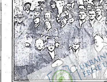
Частина делегатів і делегатів з'їзду УРФМО, сфотографовані нашим фотопортретом перед Укр. Риб. Домом в часі одної із з'їздових перерв.

2. Ми не поставили справи класової боротьби — страйків, організування й боротьби безробітних, боротьби проти терору на програмі звороту наших організацій, не в'ясували членства так як слід, а через