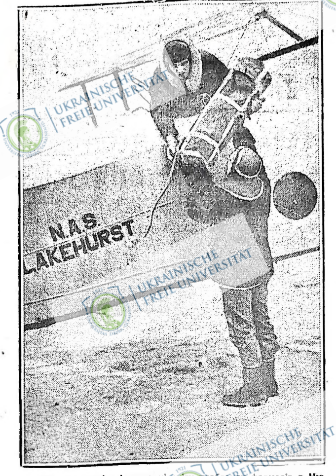
Сніжна заметіль і невдалі спроби позбавити фермерів в Нью-Джерсі усього комунізації. Лише аеропланом можна було дістатися до фермерських околиць. Ось на цій картині видно, як в Лейкхорст навантажують аероплан сировинними продуктами для населення тих околиць.