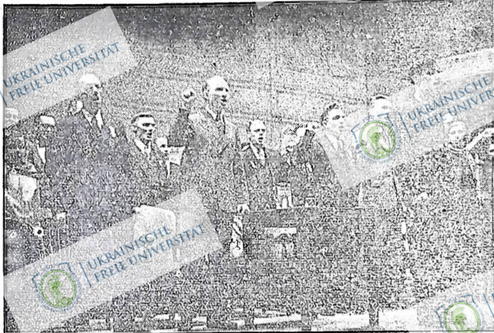
Чотири тисячі робітників слухали промови комуністичного провідника Тима Бака у великій залі в Свівік Аудиторіум. На картині видно, як він і президія мітингу співають разом з присутніми робітниками "Інтернаціонал".

Капіталісти тепер всіма силами стараються затримати тільки одне: право визискувати трудящих. Для цього воно арештування. Простими, не вишуканими словами розповідає про своє "знайомство" з генералом Дрейлсером, торонтоським шефом поліції, що грозив знищити комуністичну