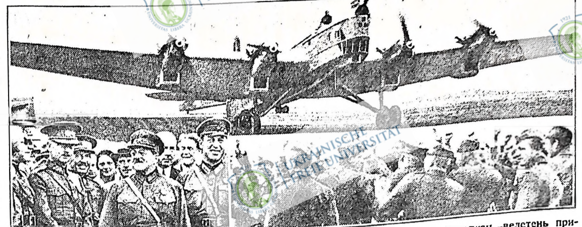
Ескадрилья Радянського Союзу в польоті через Європу. Угорі радянський аероплан—велетень прилетів на аеродром у Празі, Чехо-Словаччина. Удоліні зправа правий робітничий й робітники вітають радянську ескадрилью співом "Інтернаціоналу". Удоліні зліва посередині між пілотами видно керівника цивільної авіації СРСР, тов. І. С. Ушнілхта з відзнакою ТСОавіахему.

Ми не проти того, щоб учителі працювали за голодну платню. Учителі є потрібні, в якій би то системі ми не жили. Учні праці не є легка і фермери в більшості це розуміють. Але, на жаль, велика більшість учителів не розуміє, що вони є умовно робітниками, що за теперішню їхню шкільну заробітну платню фермерам за їхню працю. Чим більше буде, учителі зрозуміють, що їх місце по стороні незможних фермерів, тим більше буде для них і для фермерів.