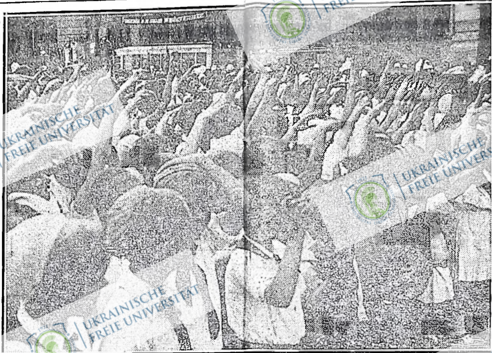
Коли 116 дітей членів австрійського Шуббунду прибули до Москви, їм влаштовано педчаю зустріч. На картині бачимо піонерів, членів комуністичної дитячої організації, як вони вітають своїх австрійських товаришів. Деякі батьки австрійських дітей загинули в боях, інші є в австрійських тюрмах, а частина з них в Москві. Ці останні перший раз побачили своїх дітей від лютневих боїв.