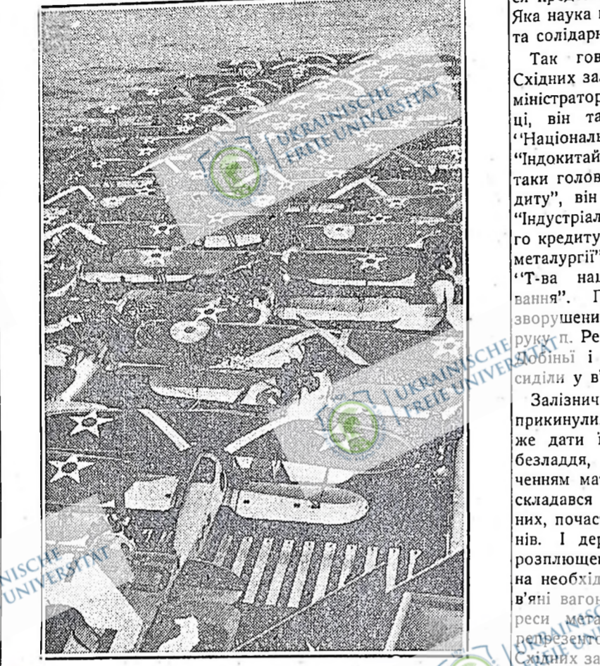
ВОЄННІ “ПТАХИ” ЧЕКАЮТЬ НА ПРОГОЛОШЕННЯ ВІЙНИ. Це воєнні аероплани в Сполучених Державах, які готові до війни, щоб сіяти довкола смерть

Дирекція Східних залізниць спочатку оголосила про кількох легко поранених. Вона довго замовчувала число жертв. Газети писали — одна про 100 жертв, друга — про 80. За два