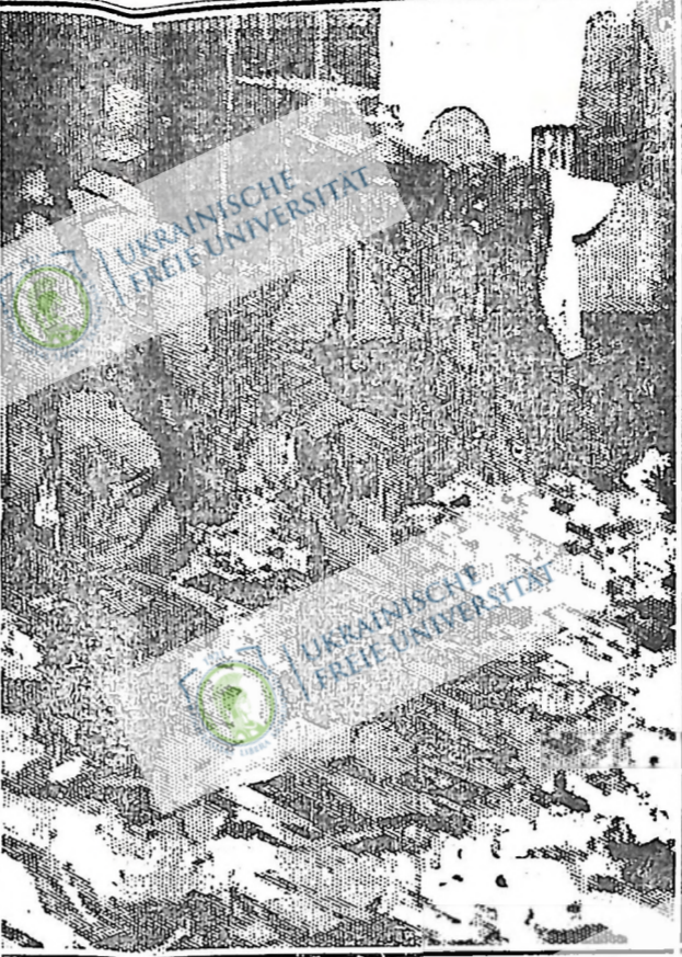
Є це сцена в місті Константіне, Альжирія, після антисемітського погрому, у яких десятки осіб убито й сотні поранено. Вулиці були заповнені одними, що його вкрали погромники і базарні і жовніри патрулювали місто. Погроми вчинили арабські фанатики після наперед виробленого плану.

В Греції відкрито змову проти уряду. Атені, Греція. — Двох генералів, трьох полковників та кількох інших офіцерів грецької армії арештовано минулого тижня за планування змови на повалення уряду. Повідомлення кажуть, що вони намагалися встановити військову диктатуру під проводом генерала Глостіраса, який втік з Греції минулого року після неуспішної спроби захопити владу.