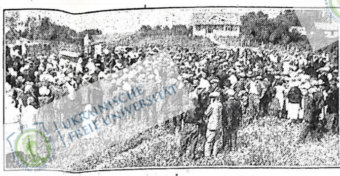
Демонстранти слухають промовців на антивоєнній і антифашистській демонстрації в Ту Гилс, Алта.

ПОВІДОМЛЕННЯ Звіт з Третьої Річної Конвенції Ліги Фармерської Єдності в Альберті вже готовий і кожний член може набути його по 5 центів за одну копію. Замовлення посилайте до: District Office FUE, 9810 Jasper Ave. Edmonton, Alta.