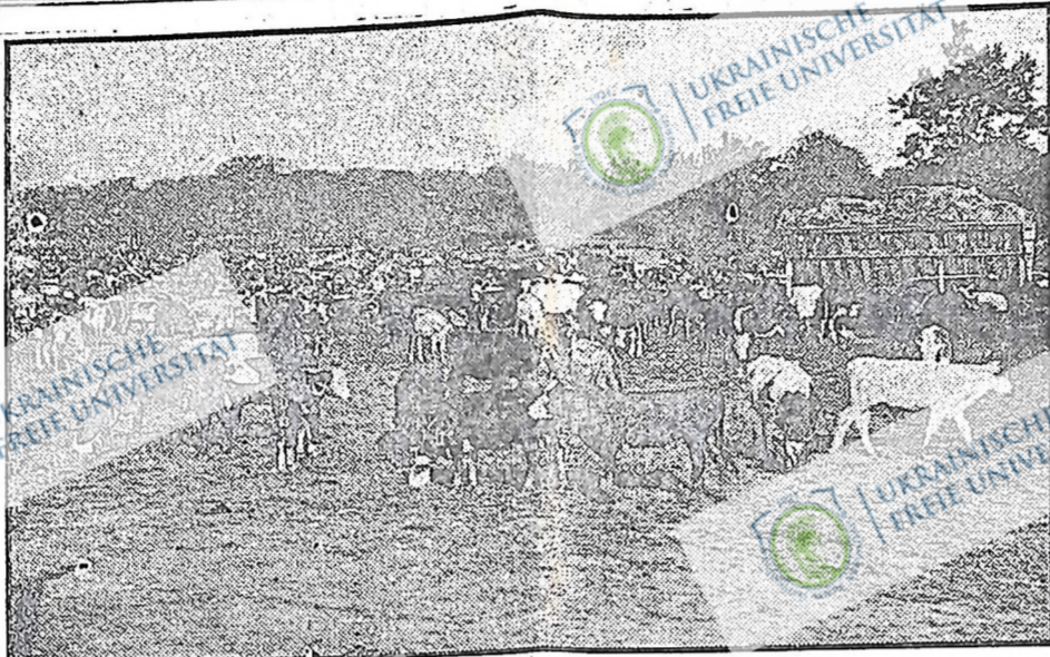
Ці малі бички пішли на ринок, а тисячі інших загинули зі спраги в середньо-західних степях Спол. Держав. Двадцять п'ять тисяч штук худоби, частину якої бачимо на цій картині, кормить уряд в Делевейр, О., щоб опісля вислати її до весняних різів.

Як виказують відомости з України, підчас живи і осінньої сіви поодинокі селяни масово вступають до колективних господарств. В селі Бегач, Березанської округи, де досі не було колективного господарства, організовано нове колективне господарство й розпочато сівбу. В інших селі, Буріно, 120 індивідуальних селян вступили до колективного господарства.