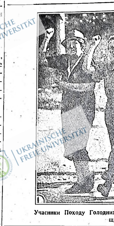
Учасники Походу Голодних провінції Онтаріо віддають пролетарський "салют" робітникам, що їх зустрічають у поході до Торонто.

стратор "комуністичної небезпеки"? Ви тільки послушайте, що про це говорить кореспондент, а тоді побачите, які то "комуністи" загрожували "щасливому" життю фермерів того муніципалу.