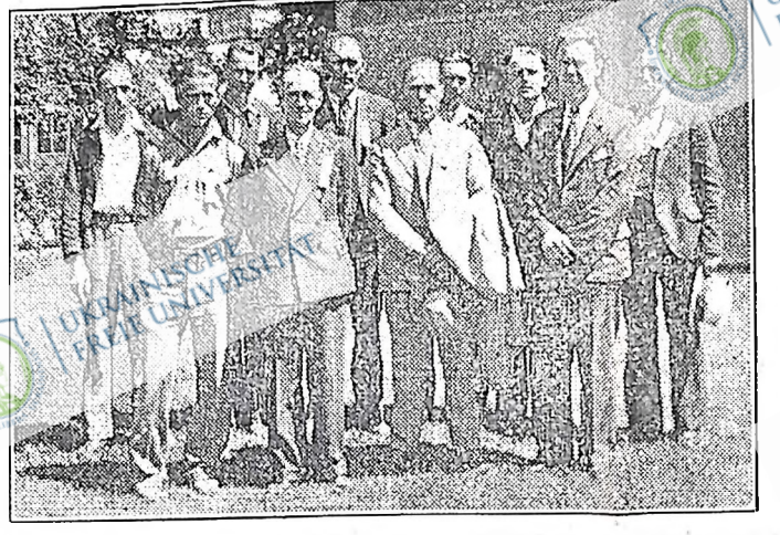
Манітобські делегати на Фармерському Конгресі в Ріджайні.