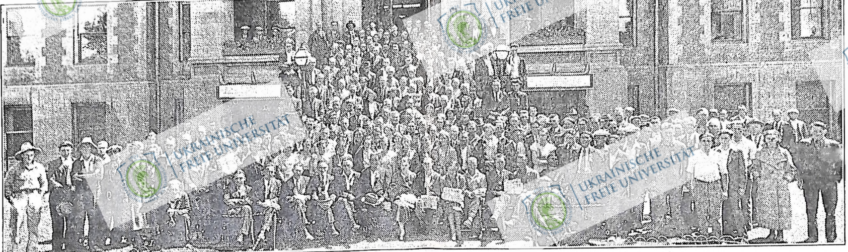
Повища картина представляє 274 фармерських делегатів, що з'їхалися з п'ятих провінцій Канади на Перший Всеукраїнський Конгрес Канадських Фармерів, який відбувся в Ріджайні, Саск., в днях 3 і 4 липня 1934 р. В Конгресі, який скликано за ініціативою Ліги Фармерської Єдності, взяли участь фармери, фармерки і фармерська молодь, що належить до різних фармерських організацій в Канаді. Конгрес прийняв бойову програму об'єднаного фронту, довкола якої Всеукраїнський Комітет повинен буде організувати всіх трудящих фармерів до боротьби за негайні домагання.

Братній американський делегат (Продовження на 6-й сторони.)