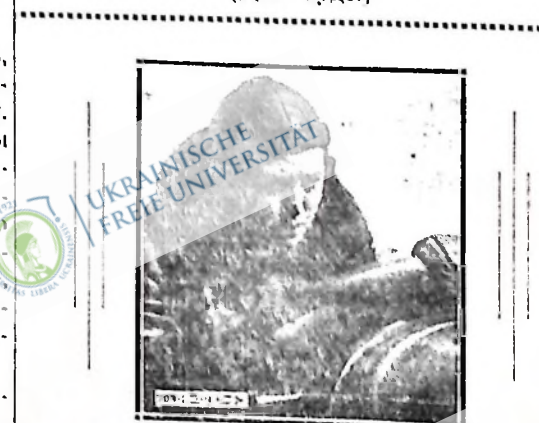
РАДЯНСКА ЖІНКА ТРАКТОРИСТКА