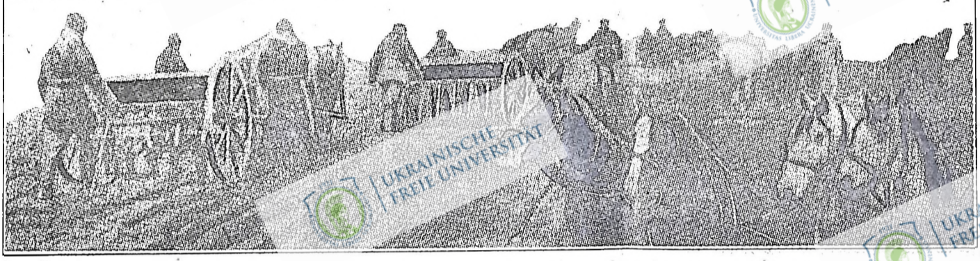
СІВБА НА ЛАНАХ КОЛГОСПУ ім. ПЕТРОВСЬКОГО (Кам'янський район)

шалений антирадянський галас схиляти ці запеклі вороги трудящих (до яких геркулесосо-ва) ставби безглузди вони діляли в своїх наклепницьких вигадках, коли трудячі маси Радянської України енергійно взяли здійснювати гасло партії про соціалістичний наступ на всьому фронті, про суцільну колективізацію й ліквідацію на цій базі куркульки, як класи.