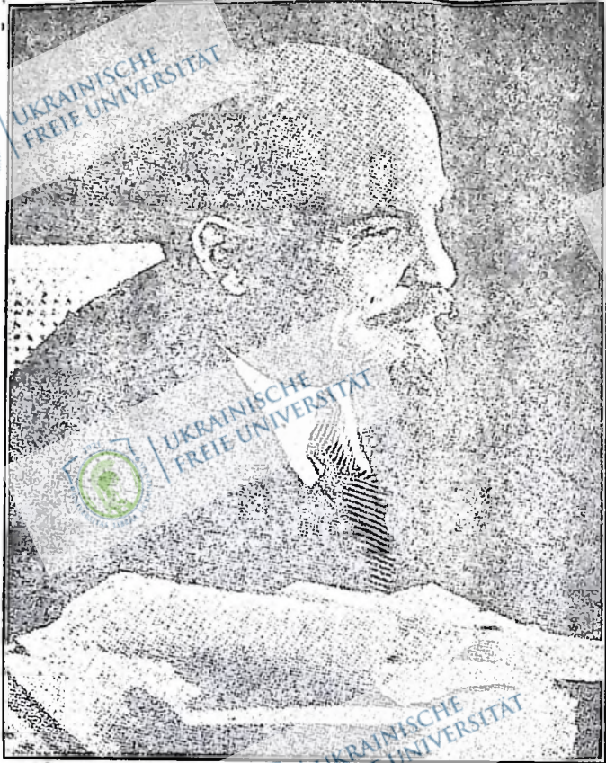
В. І. ЛЕНІН

Таким зостанеться Ленін у нашій пам'яті: Ленін — ласкава і водночас смілива дитина в спогадах близьких йому, в спо-