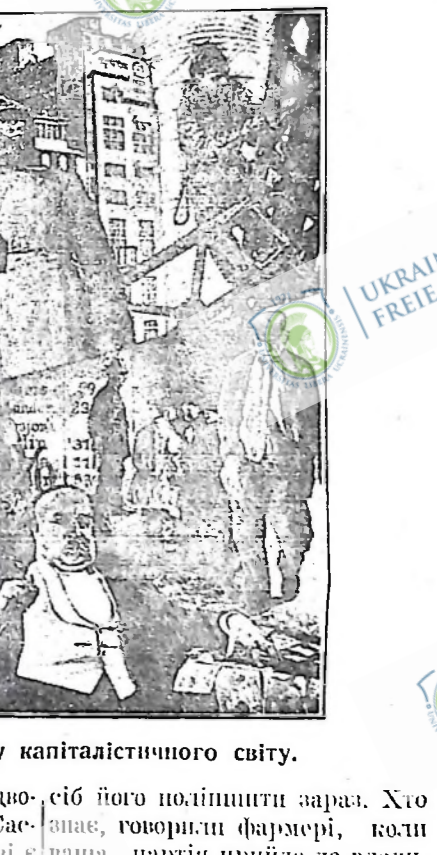
Вартовий визиску капіталістичного світу.