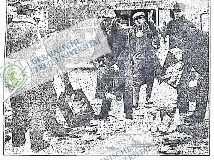
Картина представляє, як фармерські пікетчики стеїту Висконсин допнують молоко на дорогу підчас недавнього страйку молочарів шікагоського дистрикту.