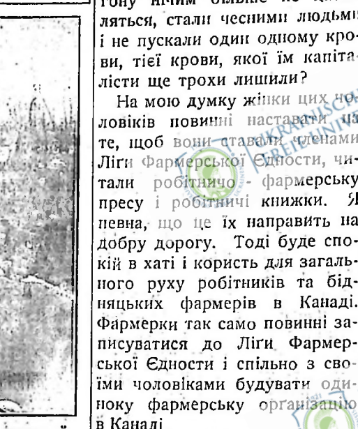
На фотографії видно частину роб