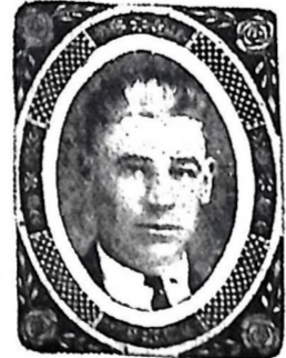
Фото медальйони, наповніши і найцінніший зделюток в обігу сучасної фотографії. Оживлений продукт має місту, блискучу поверхню, яку можна мити і витирати без найменшої шкоди для портрету. Цін цих прегарних і спосібних фотографій є порівнювано низькій. Сплатити вони від $5.00 до $7.75. Відмалюємо також фотографії на брошках, фот. листках і т. п. За першо-класну роботу гарантується. Призначені фотографії над особами або особами, що ви бажаєте відмалювати. Шість замовлень з поштою, поштовий або уміркований годинюк і відплатте за ширшими інформаціями на пошту адресу: