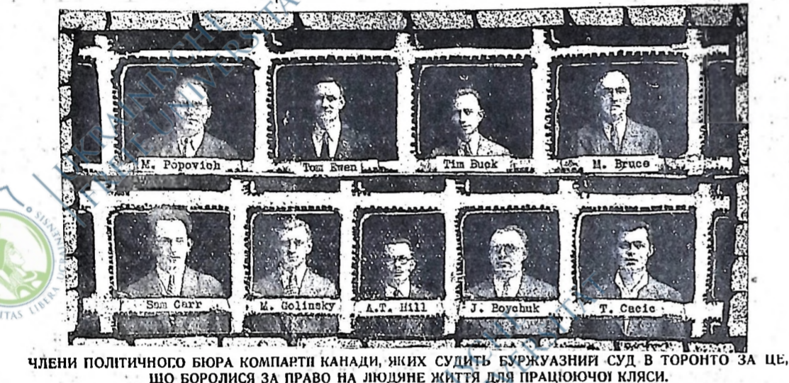
ЧЛЕНИ ПОЛІТИЧНОГО БЮРА КОМПАРТІЇ КАНАДИ, ЯКИХ СУДИТЬ БУРЖУАЗНИЙ СУД В ТОРОНТО ЗА ЦЕ, ЩО БОРОЛИСЯ ЗА ПРАВО НА ЛЮДИНЕ ЖИТТЯ ДЛЯ ПРАЦЮЮЧОЇ КЛАСИ.