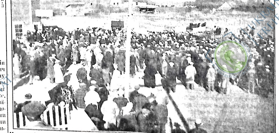
Масове віче на площі коло місточка Ту Гилс, Алта. дни 25-го лютого, в якому взяло участь велике число фермерів, фермерок та фермерської молоді.