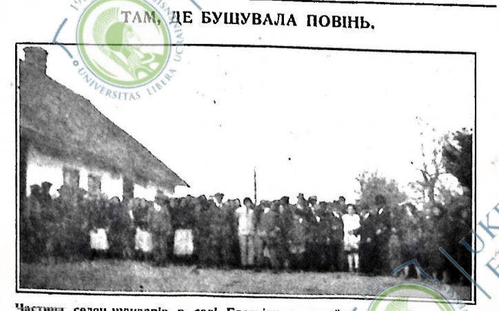
Частина селян-худярів в селі Братівцях, стрілецького повіту, перед роздачею допомоги.

Так щодня, що години буржуазія в цілому світі пакує в тюрми, гонить на заслання, на смерть кращих синів трудового народу за те, що він виступає до боротьби за свої права. Всюди по цілому світі буржуазія однакова брешуть ті, що кажуть, ніби то у “власній самостійній” буржуазній державі робітничтву легше живеться, як під “чужою” буржуазією. Для працюючих кожні буржуазія чужа. Фашист Італіець так само схотив Італійці комуніста за горло, як дефензивник Пільсудський схопив за горло українського чи білоруського робітника й селянина. І що руку ката працюючі повинні спільно відбивати всіоми.