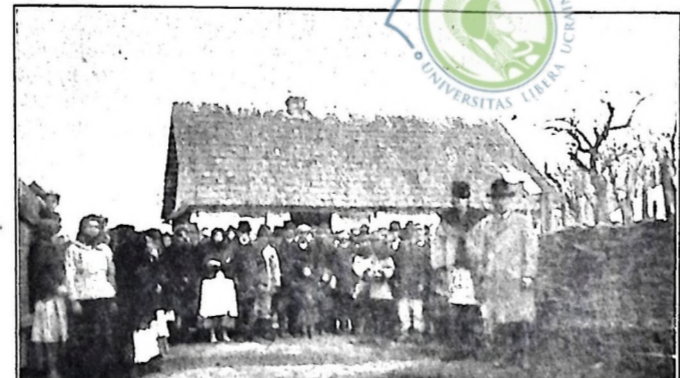
Гурт селян села Киньколюки, повіт Долина, перед розподілом допомоги.

Образки з сія і місцевостей в Галичині, де бушувала по-вінь, показують нам, яку величезну руїну спричинила вода українським селянам і населенню взагалі. Свідками цієї руїни стоять і до нині зруйновані господарства, занесені камінням, хабузям та цумом поля й городи.