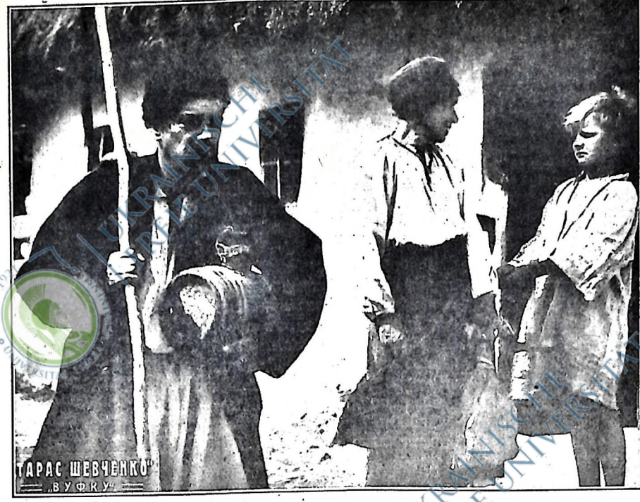
Батько й мати йдуть на панщину, а малий Тарас залишається дома.