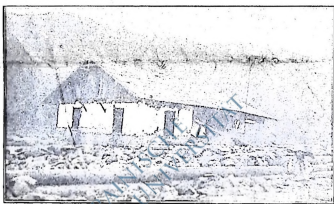
Село Устерки, повіт Косів; один з багатьох будинків, знищених водою й завалених деревам та камінням, стоїть отак розвалений і нім. Тут Черемош так бушував, що порозваливав будинки й на високих місцях, а все, що було в долині — пішло з водою.